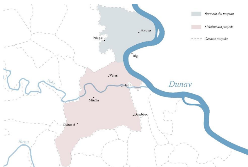
Slika 2. Župna središta na području posjeda

Aproksimativno gledano, prema Engelovoj karti, prosječna udaljenost između župa na području posjeda bila je oko 4,5 km. Ipak, postoje župe koje su bile i bliže jedna drugoj, pa su tako Borovo i Irig, jednako kao Mikola i Várasi bili udaljeni oko 3 km. To je moguće povezati i s činjenicom da je oko Mikole i Várasija razmjerno veća gustoća naselja, u odnosu na primjer na područje dumbovačke župe, pa je u toj sredini bilo potrebno više, odnosno manje župnih središta na posjedu.