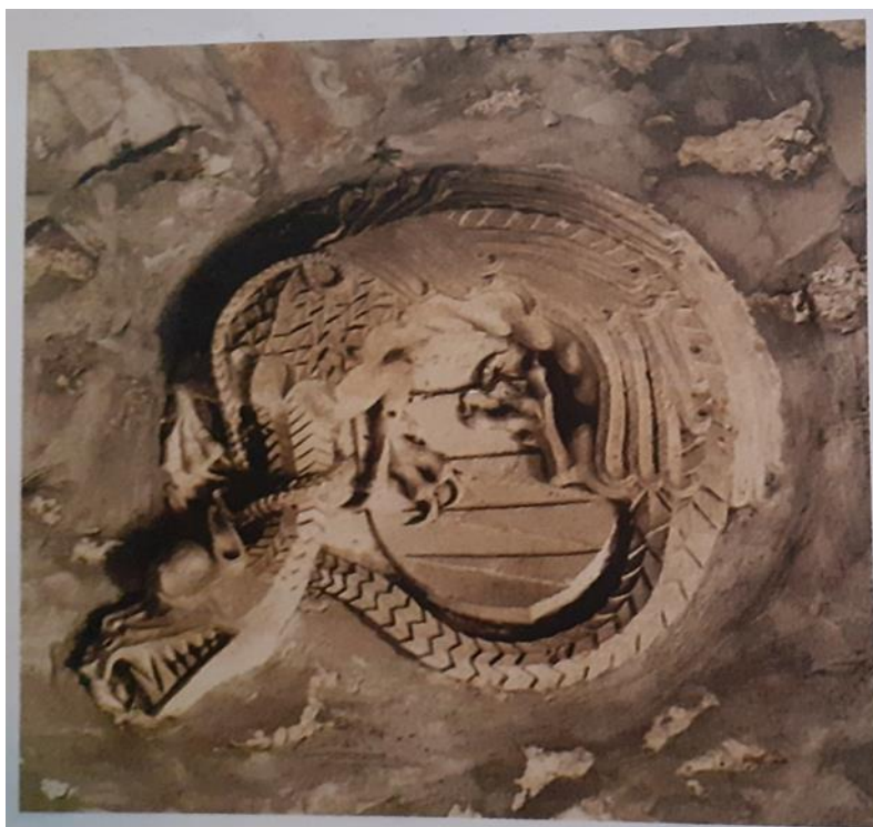
Slika 6. Grb viteškog reda zmaja koji se nalazi u zidu kule