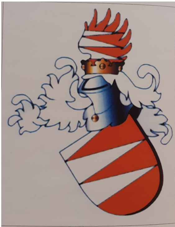
Slika 2. Grb obitelji Morovički