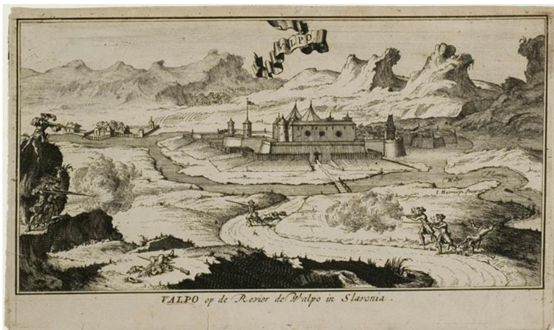
Slika 4. Tvrđava Valpovo