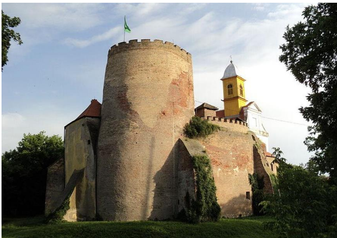
Slika 5. Ostatci tvrđave i kule Valpovo