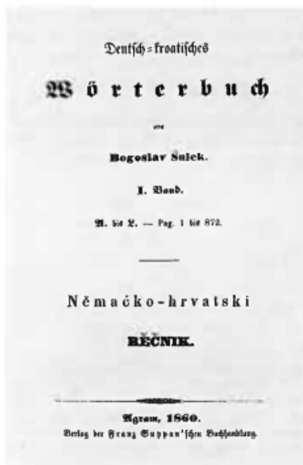
Prikaz 2. Naslovnica prvog sveska Njemačko-hrvatskoga rječnika iz 1860. godine (Gostl, 1995: 73)

Svojim dvojezičnim rječnikom, koji je ostavio veliki trag u hrvatskoj leksikografiji 19. stoljeća, Šulek je značajno pridonio stvaranju i upotpunjavanju hrvatskog leksika. „Zaključimo naposljetku da je Šulekov njemačko-hrvatski rječnik u postilirskom dobu značio ne samo oživotvorenje, već i vrhunski zamašaj i doseg postavljenih ciljeva preporodne leksikografije.“ (Gostl, 1995: 89)