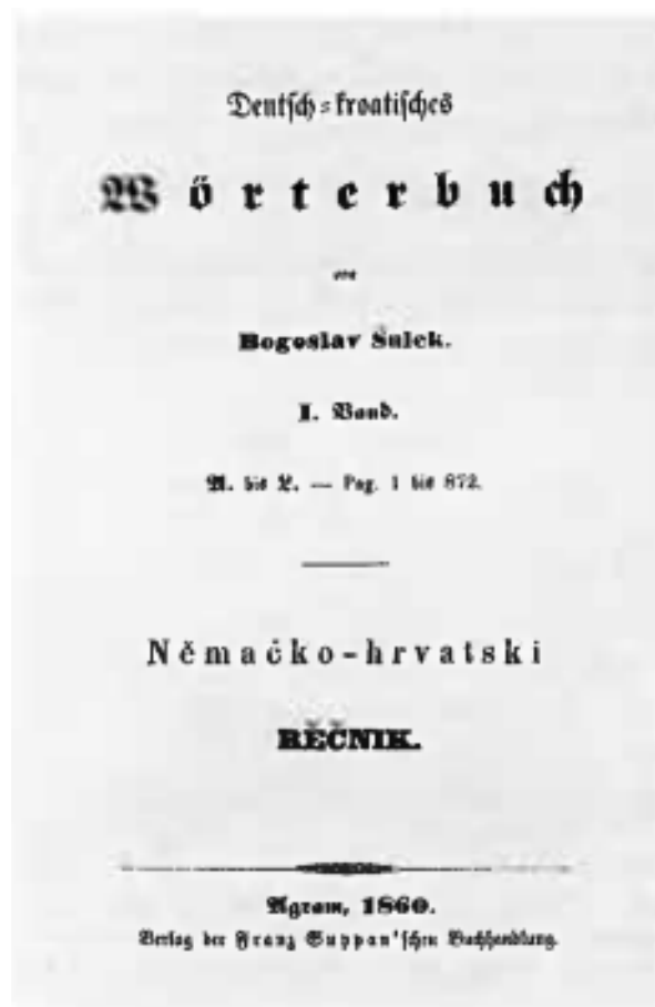
Prikaz 2. Naslovnica prvog sveska Njemačko-hrvatskoga rječnika iz 1860. godine (Gostl, 1995: 73)

Svojim dvojezičnim rječnikom, koji je ostavio veliki trag u hrvatskoj leksikografiji 19. stoljeća, Šulek je značajno pridonio stvaranju i upotpunjavanju hrvatskog leksika. „Zaključimo naposljetku da je Šulekov njemačko-hrvatski rječnik u postilirskom dobu značio ne samo oživotvorenje, već i vrhunski zamašaj i doseg postavljenih ciljeva preporodne leksikografije.“ (Gostl, 1995: 89)