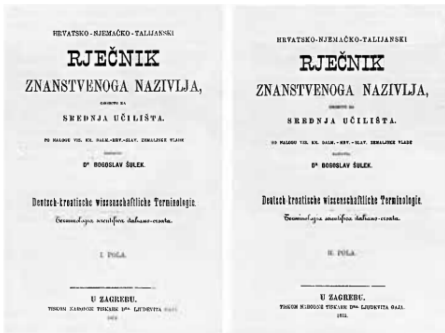
Prikaz 3. Naslovnica prvog i drugog sveska Hrvatsko-njemačko-talijanskog rječnika znanstvenoga nazivlja (Gostl, 1995: 94, 95)

Šulek sam kaže da je na rječniku radio ukupno četiri godine, po osam sati dnevno. Idućih šest godina utrošeno je na pripremanje za tisak i tiskanje. Godine 1847., prvi svezak (A–N) Hrvatsko-njemačko-talijanskoga rječnika znanstvenoga nazivlja konačno je ugledao svjetlo dana. Drugi dio rječnika (O–Ž) izlazi godinu dana kasnije, 1875. Rječnik su sačinjavale 1372 stranice, a iako je trebao biti rezultat kolektivnog rada, Šulek ga s pravom pripisuje sebi (Gostl, 1995: 97).