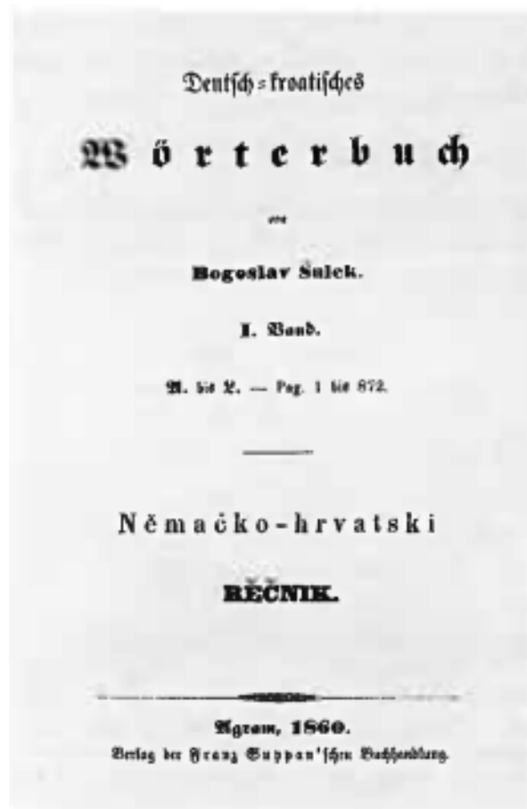
Prikaz 2. Naslovnica prvog sveska Njemačko-hrvatskoga rječnika iz 1860. godine (Gostl, 1995: 73)

Svojim dvojezičnim rječnikom, koji je ostavio veliki trag u hrvatskoj leksikografiji 19. stoljeća, Šulek je značajno pridonio stvaranju i upotpunjavanju hrvatskog leksika. „Zaključimo naposljetku da je Šulekov njemačko-hrvatski rječnik u postilirskom dobu značio ne samo oživotvorenje, već i vrhunski zamašaj i doseg postavljenih ciljeva preporodne leksikografije.“ (Gostl, 1995: 89)