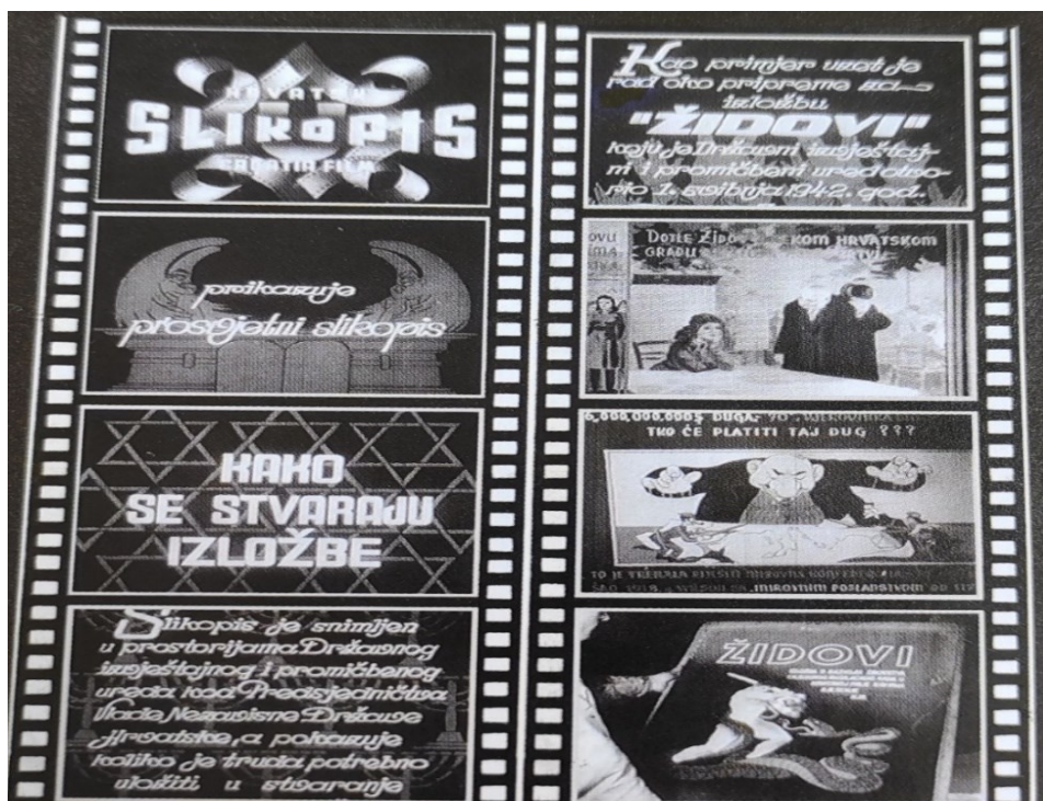
Prilog 4: Promidžbena brošura izložbe Židovi i kadrovi filma Kako se stvaraju izložbe