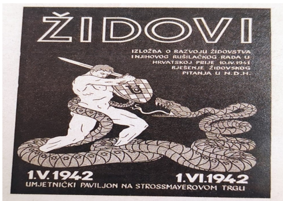
Prilog 3: Izložba Židovi