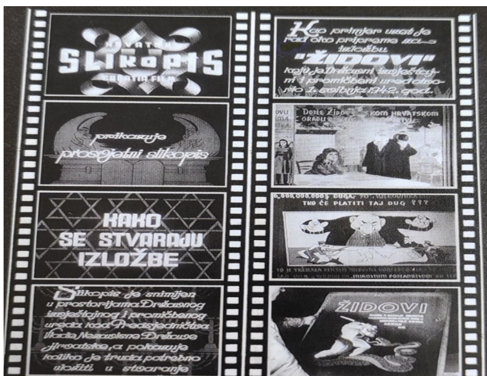
Prilog 4: Promidžbena brošura izložbe Židovi i kadrovi filma Kako se stvaraju izložbe