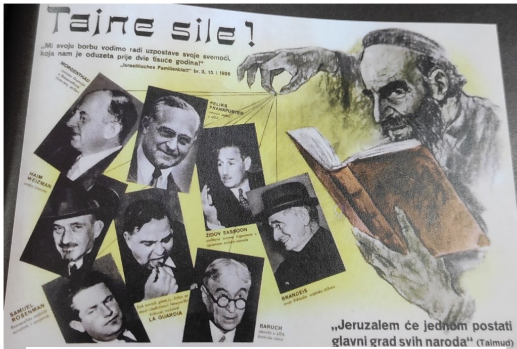
Prilog 1: Tajne sile!