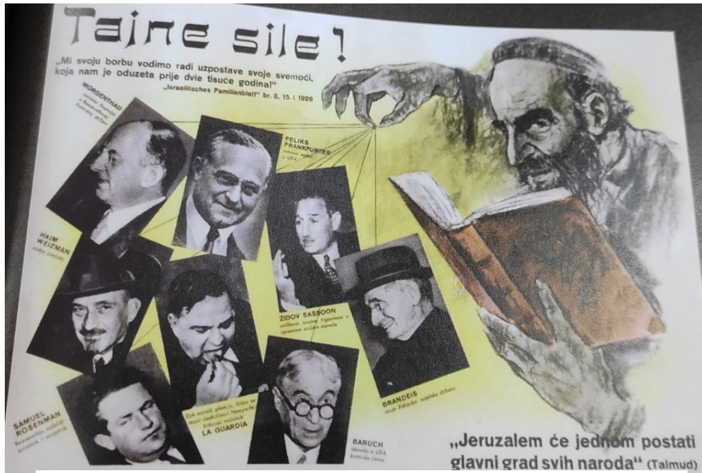
Prilog 1: Tajne sile!