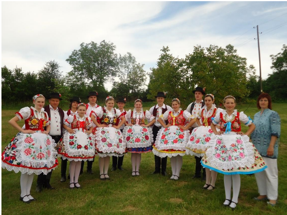
7.1.2. Kép – Kultúregyesület a 2010-es évekből