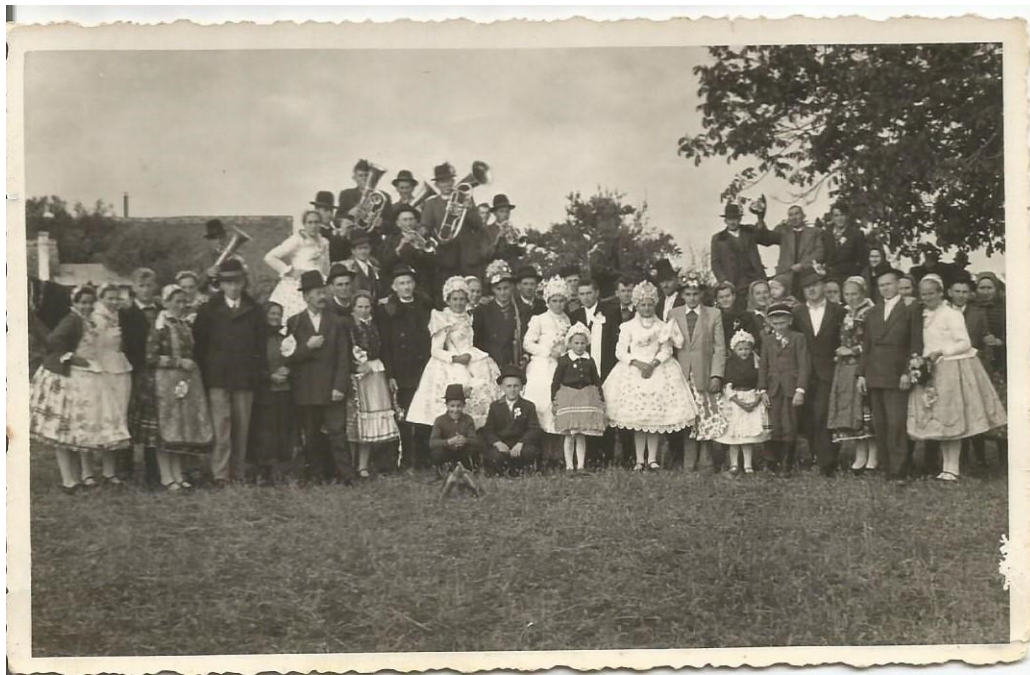
6.3.1. Kép – Lakodalom az 1950-es évekből

A lakodalom leginkább várt része a menyecske tánc volt éjfélkor. A menyecske külön viseletben volt felöltözve, és mindenki „harcolt” egy táncért. Mielőtt elkezdtek táncolni, pénzt tettek a menyecske viseletére. Azután jött a vőlegény és elvitte magával a menyecskét. Ez a különleges szokás mai napig is látható magyar lakodalmakban.