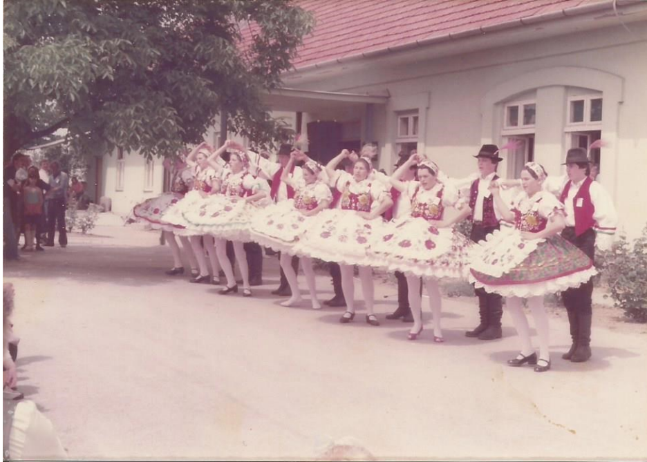
7.1.1. Kép – Kultúregyesület az 1980-as években a dályhegyi általános iskola előtt