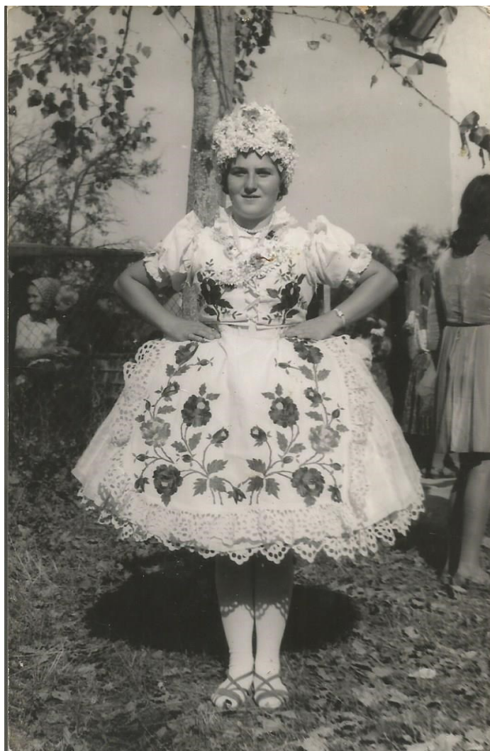
6.1.1. Kép – Népviselet, 1970-es évek