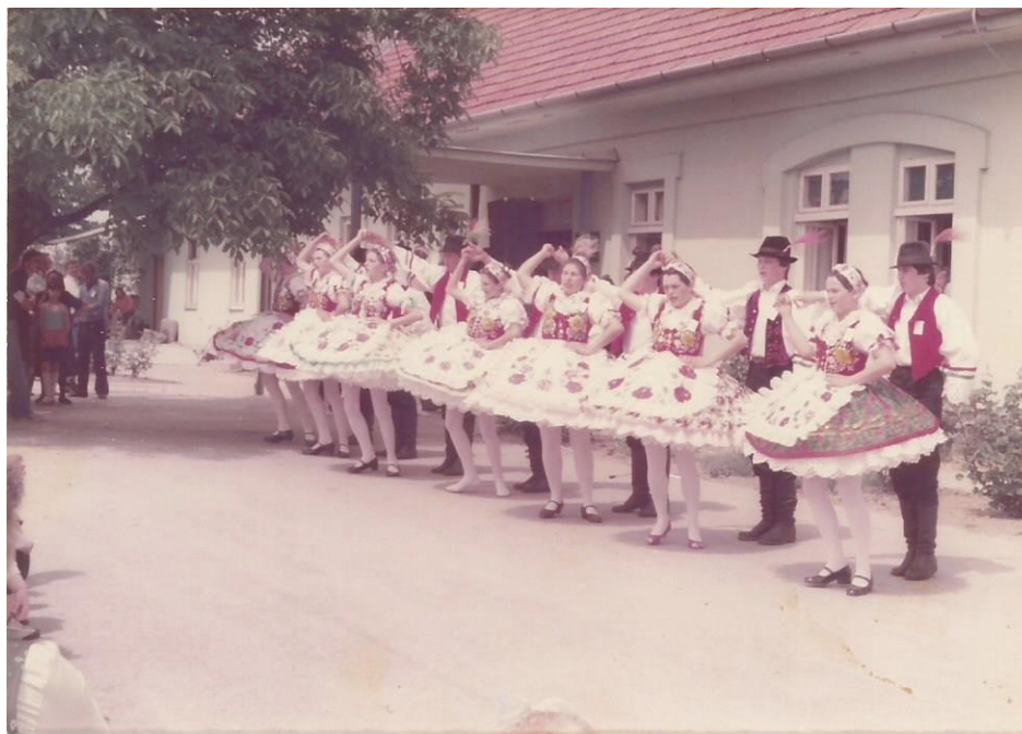
7.1.1. Kép – Kultúregyesület az 1980-as években a dályhegyi általános iskola előtt