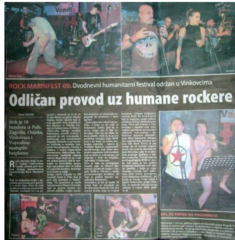
Slika 5. Članak iz Glasa Slavonije nakon 2. Rock Marinfesta (2009.)