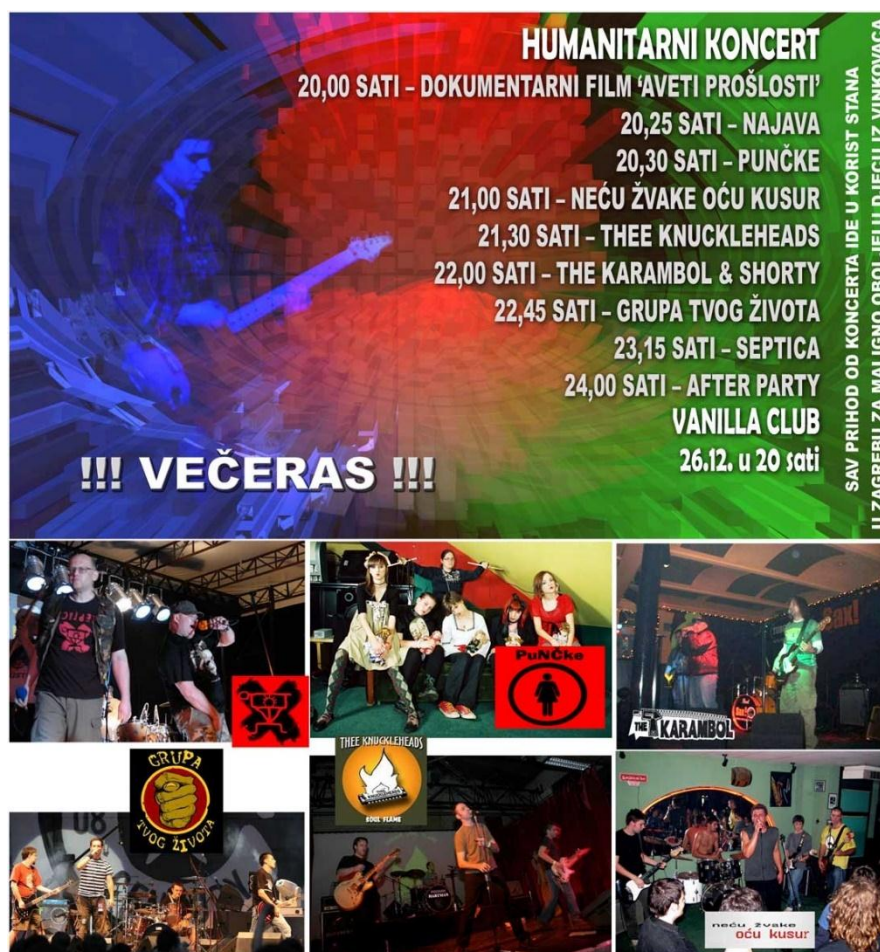
Slika 3. Plakat 1. Rock Marinfesta (2008.)