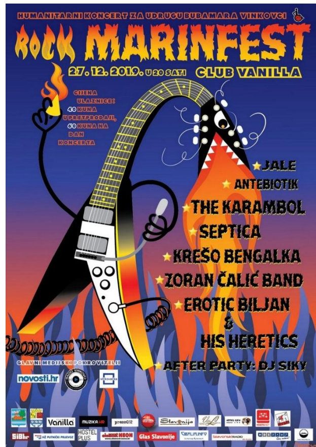
Slika 6. Najava za 12. Rock Marinfest (2019.)