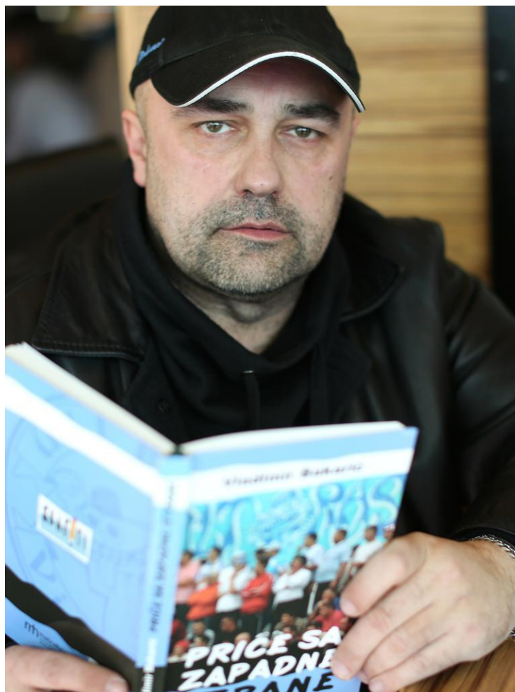
Slika 2. Vladimir Bakarić