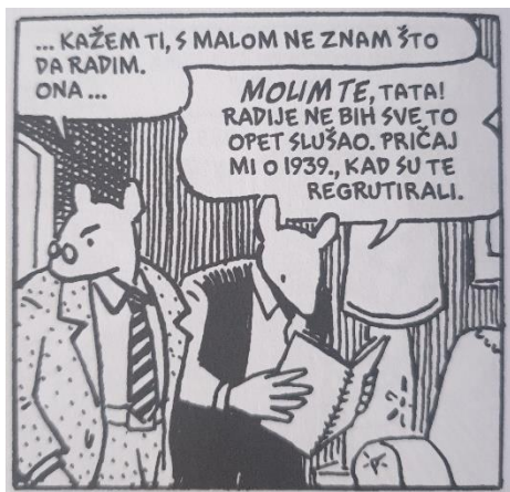
Slika 3. Maus , str. 46.