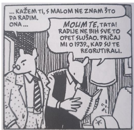
Slika 3. Maus , str. 46.