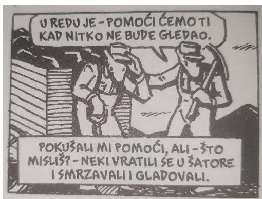
Slika 1. Maus , str. 50.