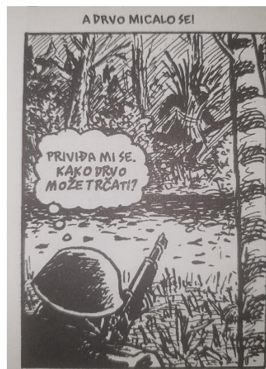
Slika 2. Maus , str. 51.