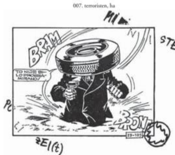
Slika 6. 007. terroristen, ha , preuzeto iz Rem, 2010: 460

U završnom će poglavlju intermedijalnom analizom biti uspoređen pjesnički tekst Ljubomira Stefanovića 007. terroristen, ha sa stripom Maus . Pjesnički tekst i strip usporedit će se na razini forme, subjekta te teme sa stilom u svim aspektima: Kada je riječ o neposrednoj strukturalnosti pjesničkog teksta, važno je znati kako ju čine četiri strukture – forma, tema, subjekt i stil, s tim što je stil integriran u svaku od prethodnih (Jukić, 2020) Na slici 6. prikazan je Stefanovićev pjesnički tekst.