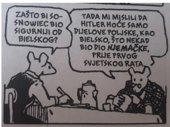
Slika 4. Maus , str. 39.

Josip Silić navodi da se u intervjuu novinar, uz pomoć svojih poticajnih riječi, „srođuje“ s jezikom intervjuirane osobe te tako postiže svojevrsnu jezičnu interaktivnu cjelinu (Silić, 2006: 79), što se vidi u Artovu jeziku kojim motivira Vlodeka, ali i usmjerava komunikaciju.