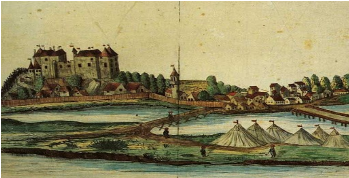
Slika 1. Veduta Vukovara iz 1608. godine (Vlado Horvat, Filip Potrebica, „Vukovar i okolica pod turskom/osmanskom vlašću“, u: Vukovar – vjekovni hrvatski grad na Dunavu , ur. Igor Karaman (Zagreb, 1994), 126)

Od današnjih ostataka ovog srednjovjekovnog grada spominje ih se vrlo malo. Jedno od rijetkih arheoloških istraživanja na samom dijelu franjevačkog samostana izvršio je Brane Crlenjak te je objavom rezultata ustanovio kako je na potezu današnje Gajeve ulice pronašao zid debljine oko jednog metra. Analizom tog nalaza pretpostavio je kako se radi o čelnom zidu jedne od kula kraljevske utvrde te je zid po tehnici izrade datirao u srednji vijek, i to približno u 13. ili 14. stoljeće, odnosno doba prve faze izgradnje utvrde. 70