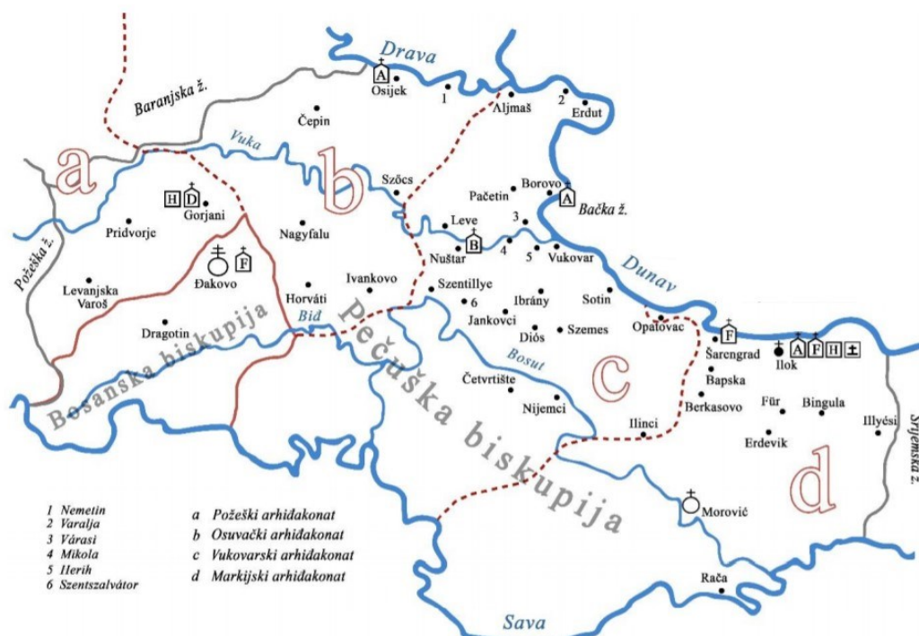
Slika 3. Crkvena organizacija Vukovske županije (Danijel Jelaš, „Rekonstrukcija srednjovjekovne urbane mreže Vukovske županije na temelju analize centralnih funkcija“, 245)

Biskupija se sastojala od ukupno osam arhidakonata. To su bili arhidakonati sa središtima „u Tolni, u Regölyu, u Vátyu, u Baranji, u Aszuágu (Osuvag), u Vukovaru, u Požezi i u Markiji.“ 101 Zbog teritorijalne nepodudarnosti granica arhidakonata i županija, Vukovska je županija tako bila podijeljena između četiri arhidakonata, onog markijskog koji je bio na istoku, požeškog na zapadu, osuvaškog na sjeverozapadu i vukovskog koji se prostirao kroz samo središte županije. 102