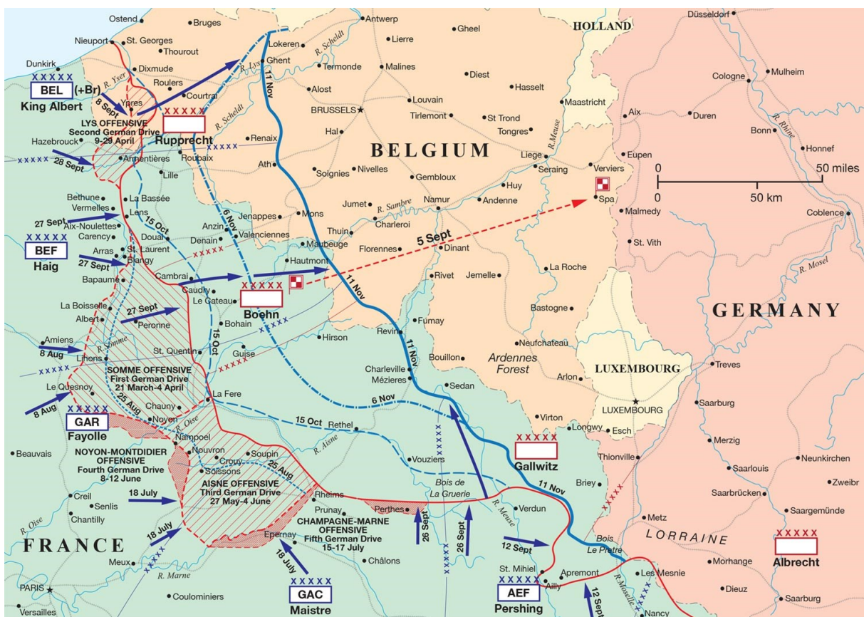
Slika 1 – stanje na Zapadnom frontu za vrijeme Njemačke proljetne ofenzive

napreduju zajedno. Pješaštvo je dobilo lake strojnice, minobacače i pušćane granate. 9 Trideset divizija obučeno je za novu taktiku, ali je imalo manje opreme od elitnih divizija, a ostatak je bio lišen materijala za opskrbu te su im oduzete preostale tovarne životinje. 10 Na sjeveru, dvije njemačke vojske napale bi obje strane izbočenja kod Flesquièresa, stvorenog za vrijeme Bitke na Cambraiju. Nadalje, 18. vojska, prebačena s Istočnog fronta, planirala je svoj napad s obje strane St. Quentin kako bi stvorila razdor između pozicija britanske i francuske vojske. Dvije sjeverne vojske tada bi napale britansku poziciju oko Arrasa, prije nego što bi nastavile svoje napredovanje sjeverozapadno te na taj način okružile BEF u Flandriji. Njemački cilj na jugu bio je doći do Somme i zadržati liniju rijeke odbijajući moguće francuske protunapade. Južni napredak proširen je kako bi uključio i zauzimanje područja preko Somme. 11