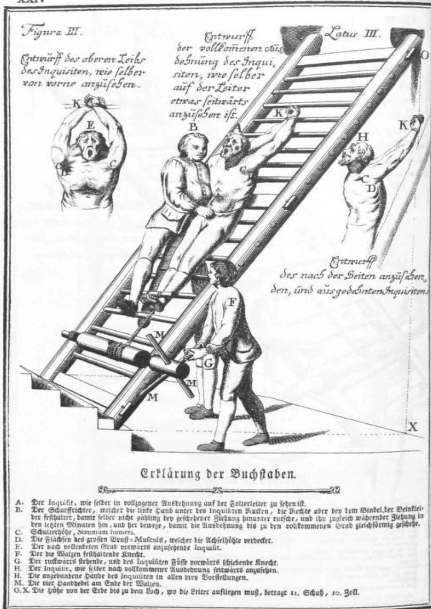
Prilog 2.: ljestve za razvlačenje tijela