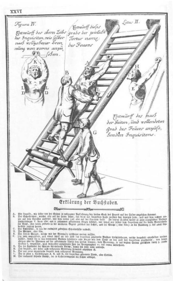
Prilog 3. Spaljivanje tijela na ljestvama za mučenje