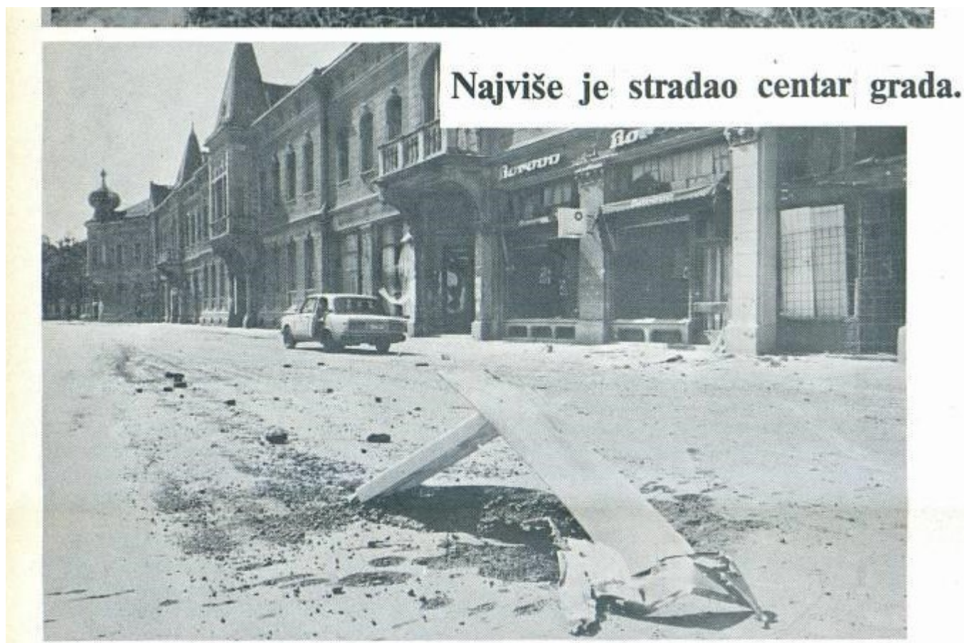
Prilog 1. Rupa od projektila u samom centru grada Vinkovaca, (Vinkovački list, 4.10.1991.)

Ratna zbivanja nisu se osjetila samo na bojišnici, nego i u svim djelovima životima građana. Sve gradske civilne službe i institucije bile su uključene u ratna zbivanja, ali i same su bile meta istih.