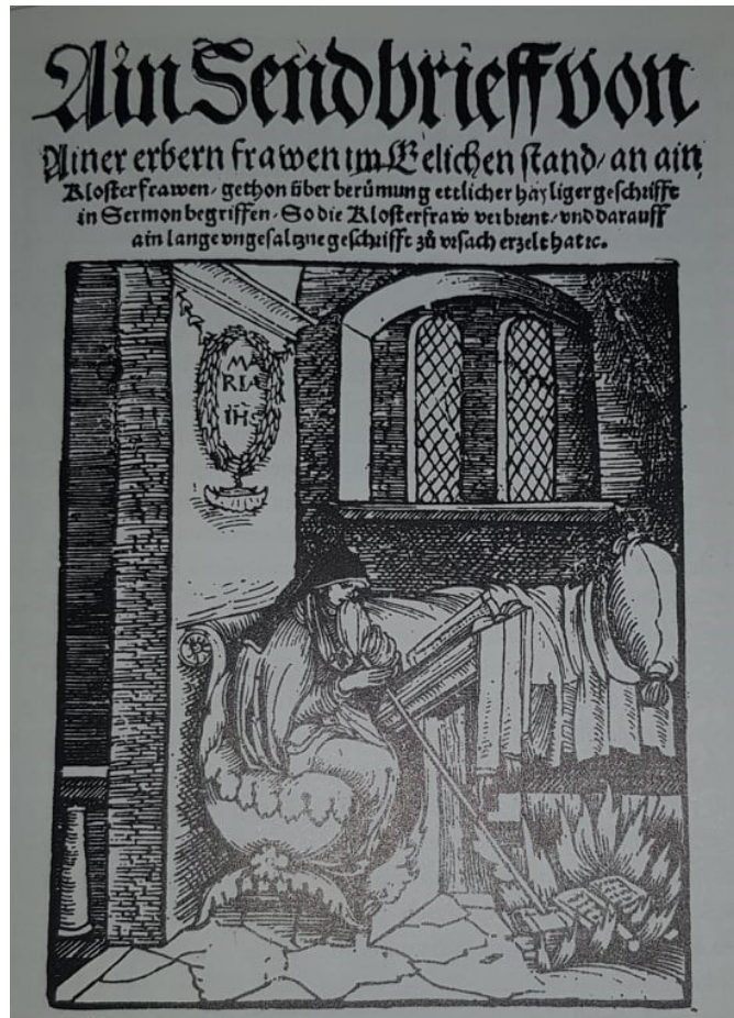
Slika 7. Omotna stranica poslanice iz 1524. godine.