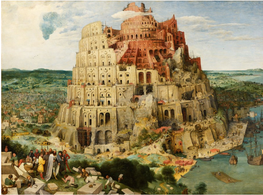
Slika 1. Pieter Bruegel Stariji, Babilonska kula (1563.)