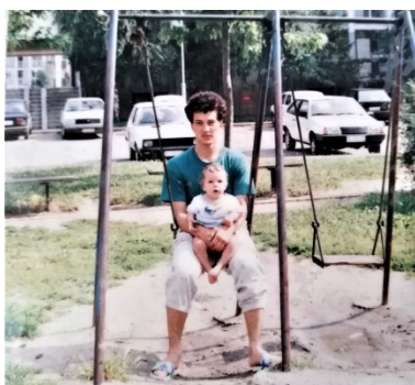
Prilog 6. Jedna od fotografija iz razdoblja prije Domovinskog rata, 1989. godina