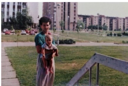
Prilog 3. Osječki Sjenjak prije rata, 1989. godina