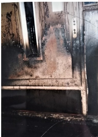
Prilog 4. Zgrada na Sjenjaku, 1991. godina