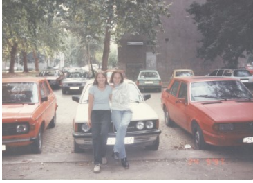
Prilog 11. Mladi u naselju Drvljanik nakon Domovinskog rata.