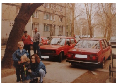
Prilog 9. Žuto parkiralište – svojevrsni simbol Drvljanika, 1995. godina