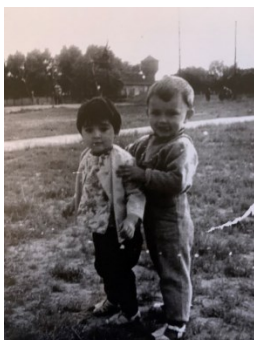
Prilog 8. Djeca s Drvljanika, 1965. godina