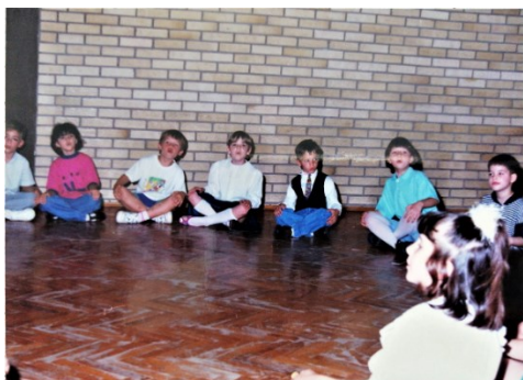
Prilog 5. Djeca u vrtiću „Sjenčica“ na Sjenjaku, 1996. godina