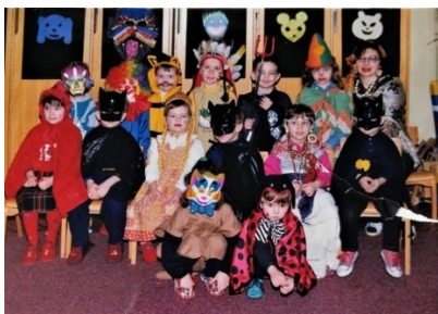
Prilog 7. Polaznici Dječjeg vrtića Sjenčica, 2001. godina