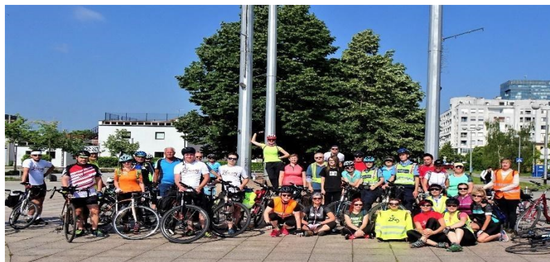
Slika 4. Sudionici kampanje „I ja želim čitati“

organizirala u suradnji s Općinom Peteranec i Udrugom za pomoć osobama s intelektualnim teškoćama Latice . 100 Sudionici ove biciklijade mogli su uživati u kratkom edukativno-glazbenom programu koji je organizirala Udruga štovatelja Frana Galovića "Galovićevo dom" te su posjetili Muzej grada Koprivnice i upoznali se s djelima akademskog kipara Ivana Sabolića. 101 Biciklom od Koprivničke knjižnice do Koprivničkog Ivanca , naziv je druge biciklijade koju je organizirala ova knjižnica 2019. godine u suradnji s Općinom Koprivnički Ivanec , Udrugom za pomoć osobama s intelektualnim teškoćama Latice , Muzejom grada Koprivnice i Biciklističkim klubom "Rotor" . 102 Akcija je i ove godine održana u znak potpore kampanji za osobe s teškoćama u čitanju i disleksijom "I ja želim čitati" te su sudionici imali priliku upoznati se s lokalnom kulturnom baštinom pod nazivom "Ivanečki vez".