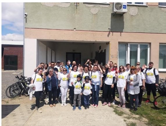
Slika 5.: Sudionici bibliocikliranja Osijek – Čepin