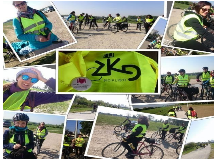
Slika 2. ZKD Biciklisti

projekt s vremenom uspješno proširuje na cijelu Hrvatsku pod nazivom Biciklom kroz knjižnice Hrvatske . 82 Prva biciklijada u sklopu ovog programa, organizirana je 2018. na ruti od Zagreba do Karlovca. 83 ZKD Biciklisti pokušavaju skrenuti pozornost na svoj rad tako što sudjeluju na različitim manifestacijama poput Noći knjige, Dana planeta Zemlja, Zeleni festival – Okrenimo na zeleno, Europski tjedan mobilnosti, Festival znanosti, „Let’s Go Green!“ – 1. međunarodna konferencija o zelenim knjižnicama, itd. 84