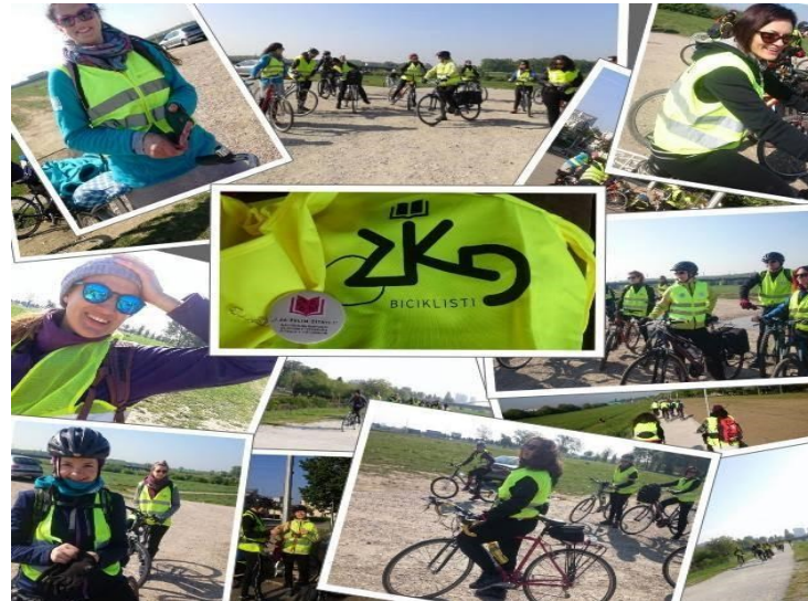
Slika 2. ZKD Biciklisti

projekt s vremenom uspješno proširuje na cijelu Hrvatsku pod nazivom Biciklom kroz knjižnice Hrvatske . 82 Prva biciklijada u sklopu ovog programa, organizirana je 2018. na ruti od Zagreba do Karlovca. 83 ZKD Biciklisti pokušavaju skrenuti pozornost na svoj rad tako što sudjeluju na različitim manifestacijama poput Noći knjige, Dana planeta Zemlja, Zeleni festival – Okrenimo na zeleno, Europski tjedan mobilnosti, Festival znanosti, „Let’s Go Green!“ – 1. međunarodna konferencija o zelenim knjižnicama, itd. 84