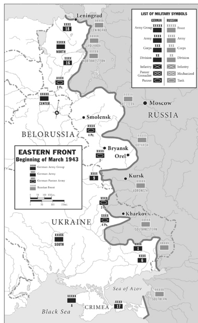
Slika 1: Stanje na istočnom frontu do 1943. godine.

očekivao napad na jugu u dijelu Kavkaza. Njemačke snage ponovno su brzo napredovale, ali ovaj put zbog manjka sovjetskih vojnika u tim dijelovima države. Hitler je sada kao cilj imao Staljingrad – simbolični centar države. Nadao se brzom pobjedi nad sovjetskom vojskom kako bi mogao ponovno većinu svojih snaga prebaciti prema Moskvi. Unatoč pomnom planiranju, Hitler je ponovno podcijenio Sovjete; bitka za Staljingrad trajala je predugo i iscrpila je njemačku vojsku više nego što je itko predvidio stoga je Hitler bio primoran na povlačenje vojske. 6