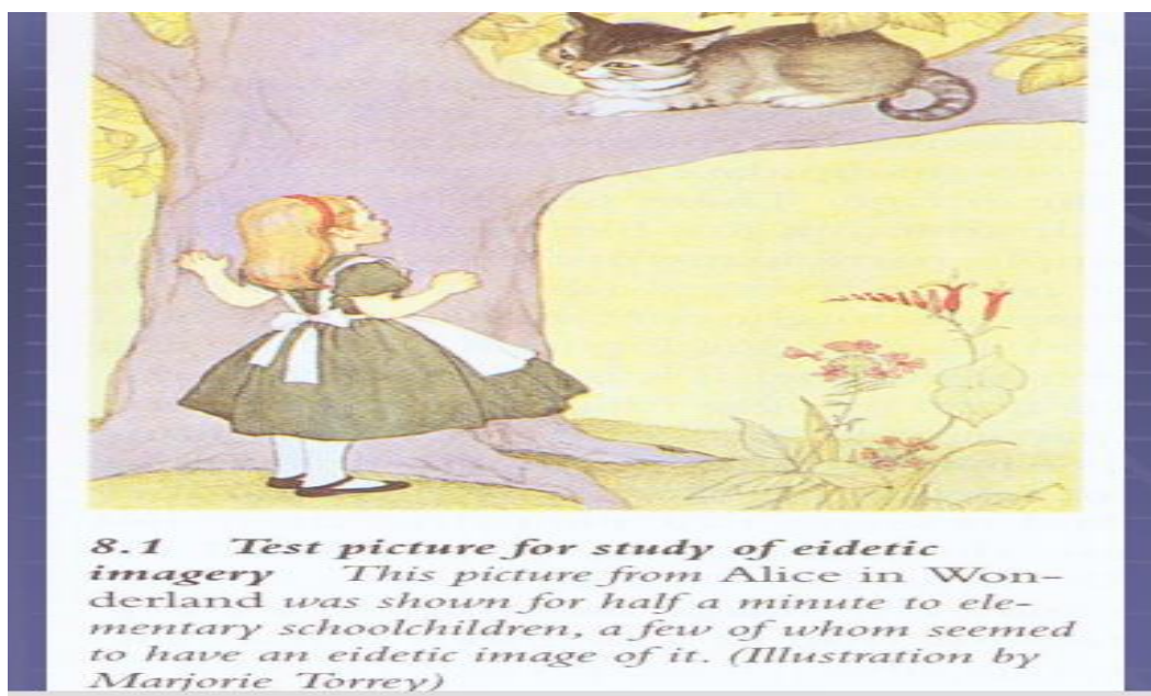
Slika 1. Primjer testa eidetskog pamćenja

Rezultati su pokazali kako vrlo malo djece (manje od 5 %) u navedenom istraživanju, posjeduje sposobnost eidetskog pamćenja. Za odrasle osobe je postotak bio manji (manje od 1 %). Istraživači su ovu razliku pripisali manje razvijenim verbalnim i semantičkim sposobnostima kod djece te se iz tog razloga ona u ranijim godinama više oslanjaju na pamćenje slika (Richardson i Harris, 2001).