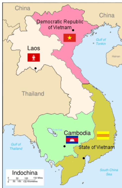
Slika 1. Podjela Vijetnama 1954. godine 8