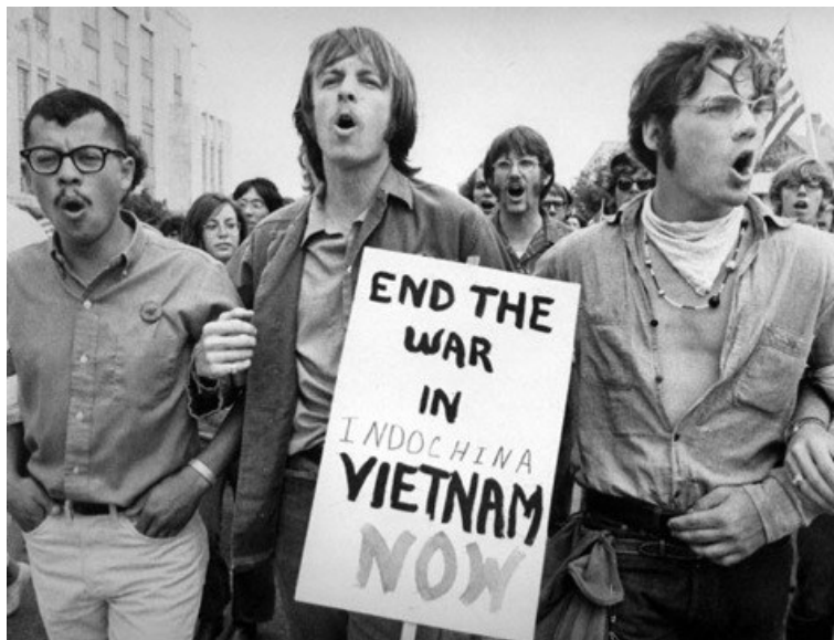
Slika 3. Antiratni prosvjed 48

Hippie kultura nastala je u vrijeme društvenih sukoba. Situacija u Vijetnamu potaknula je hipije na društvene akcije. Međutim, politički aktivizam nije bio od velike važnosti pokreta. Hipiji su suosjećali s političkim uzrocima u navedenom razdoblju, no nikako se nisu povelili za njima. Hipiji su se pojavili u suprotnosti s uobičajenom, konvencionalnom kulturom te su, iz tog razloga, izrazili svoje protivljenje uspostavljanja zakona i rata u Vijetnamu. Često su sudjelovali u prosvjedima, marševima i drugim političkim pokretima, no odbijali su biti politički aktivni. 47