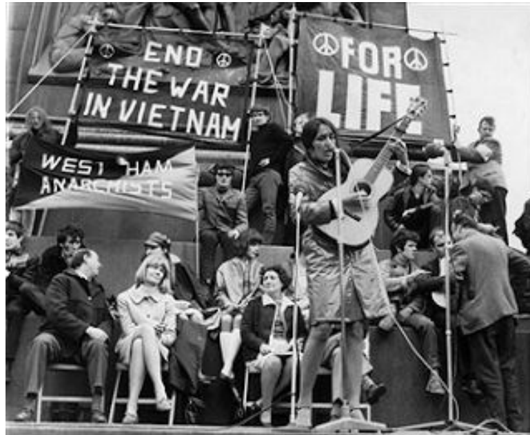
Slika 4. Antiratni koncert 54

zbog antiratnog pokreta koji je sve više dolazio do izražaja. Njegove pjesme, poput „The Times They Are A-changing“, „Blowing in the Wind“ i „Masters of War“ zauzimaju mjesto u povijesti kao pjesme s izraženom porukom mira i ogorčenosti zbog stanja u svijetu koje je osjećalo stanovništvo. Bob Dylan svakako se smatra najvažnijim glasom antiratnog pokreta. Također, jedan od najvažnijih događaja bio je Woodstock 1969. godine. Na tom festivalu nastupili su svi poznati glazbenici koji su poslali poruku mira cijelom svijetu. 53