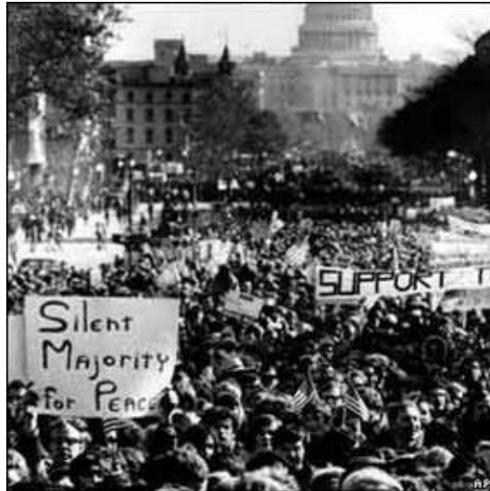
Slika 2. Golubovi protiv Jastrebova 31

kako bi se i nasilje okončalo. Glavni cilj skupine Golubova bilo je izbjegavanje rata dok su se Jastrebovi posvetili iskorištavanju rata za postizanje željenih ciljeva. 30