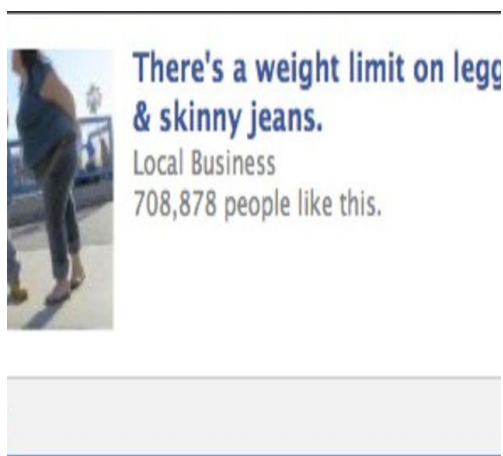
Slika 2. Primjer grupa koje promoviraju govor mržnje (Greenberg, 2009).