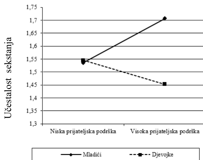
Slika 2. Interakcijski efekt prijateljske podrške i spola na učestalost sekstanja

prediktorom pokazala se jedino interakcija prijateljske podrške i spola ( \beta = -.09, p < .05 ), pri čemu je u ovom koraku objašnjen dodatni 1% varijance kriterija. Na slici 2. prikazan je interakcijski efekt prijateljske podrške i spola na učestalost sekstanja. Vidljivo je da je uključenost u sekstanje kod mladića i djevojaka koji percipiraju nisku prijateljsku podršku vrlo slična. S porastom percipirane prijateljske podrške učestalost sekstanja kod mladića raste, dok kod djevojaka nema značajne promjene.