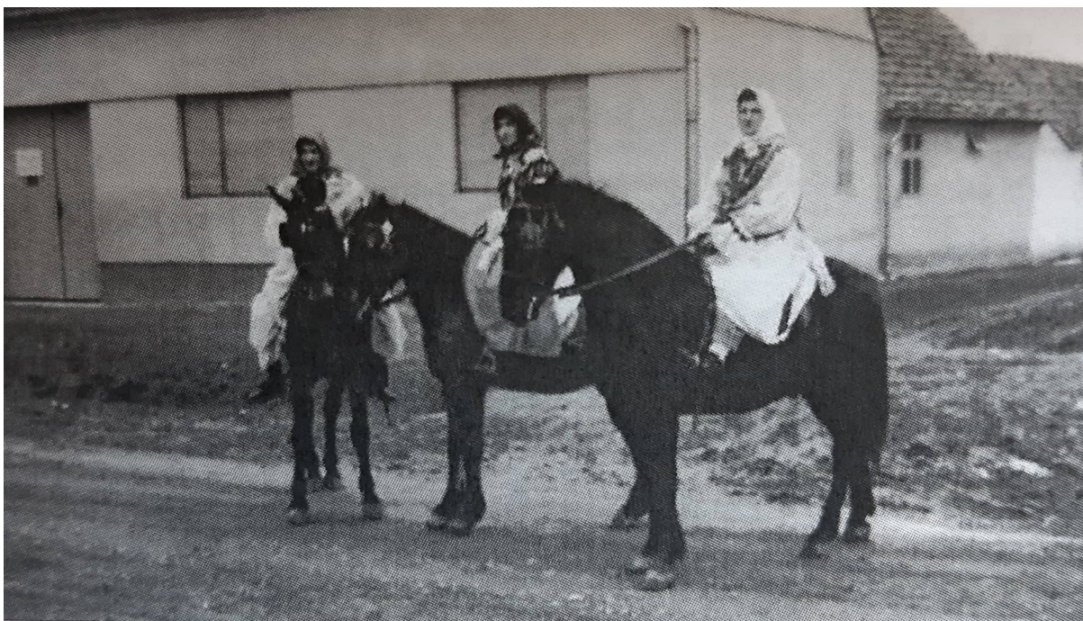
Slika 1. Pokladni jahači – bušari, oko 1960. ( Raić, 2016: 142)

Zadnji dan poklada, na pokladni utorak, još se momci i djevojke oblače u bušare i zabavljaju se po selu dok crkveno zvono ne nagovijesti da je stigla Korizma.