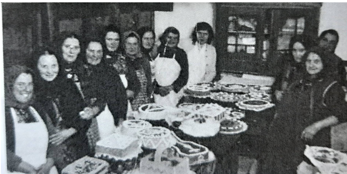
Slika 13. Kuvarice s tortama u svatovima, Stari Mikanovci ( Raić, 2016:142)