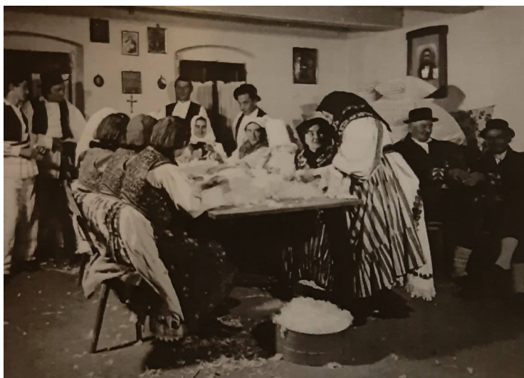
Slika 20. Čijalo u Mikanovcima ( Raić, 2016: 163)

Čijala su bila prilika da mladi igraju i pjevaju pa su se tako najčešće igrala kola: Ljubi kolo , Velike nevolje , Mista , Aj na livo i Kolo , kako se u Starim Mikanovcima nazivalo današnje Šokačko kolo .