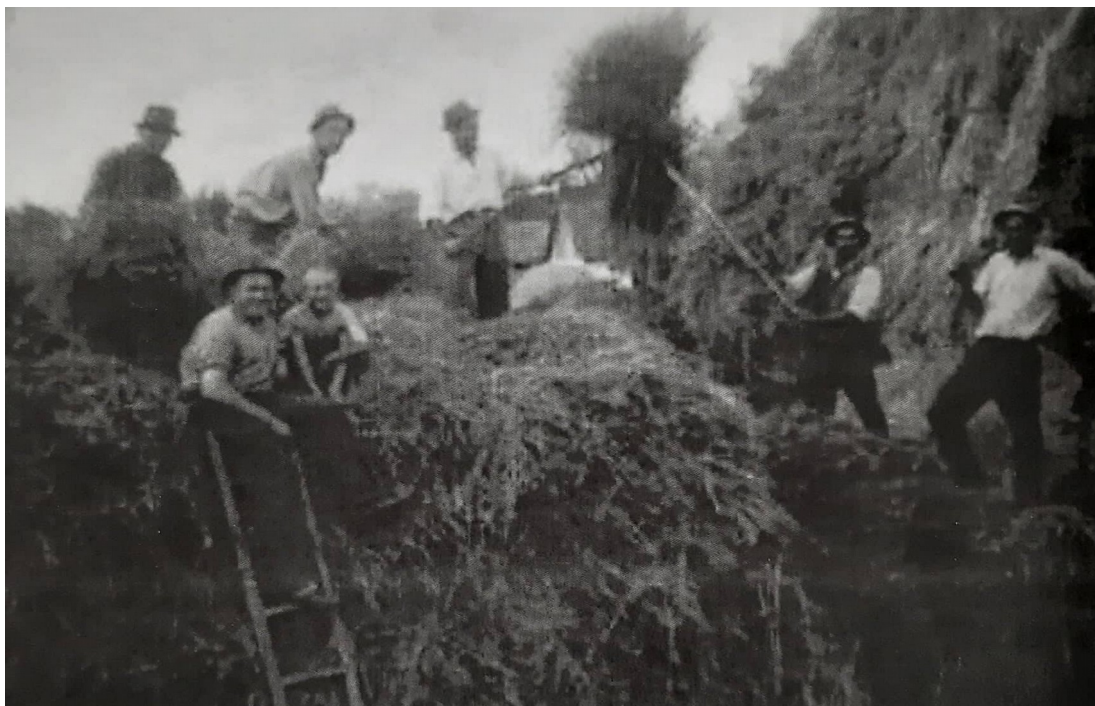
Slika 4. Vršidba u Starim Mikanovcima

do tri dana. Muškarci kose, a žene kupe i prave užad od slame za vezanje snopova. Snopove veže muškarac, a zatim svi zajedno slažu snopove u tzv. „ krstake “, a potom bi žito vozili na gumno ( mjesto za vršidbu) i tamo ga slagali u tzv. kamare ( gamare ). Tu će biti obavljena vršidba“ ( Ivanković, 2003: 19).