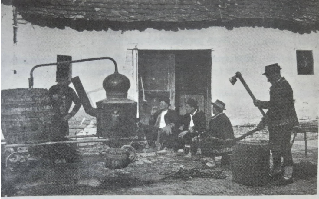
Slika 8. Pečenje rakije – Ivankovo ( Njikoš, 1988:173)