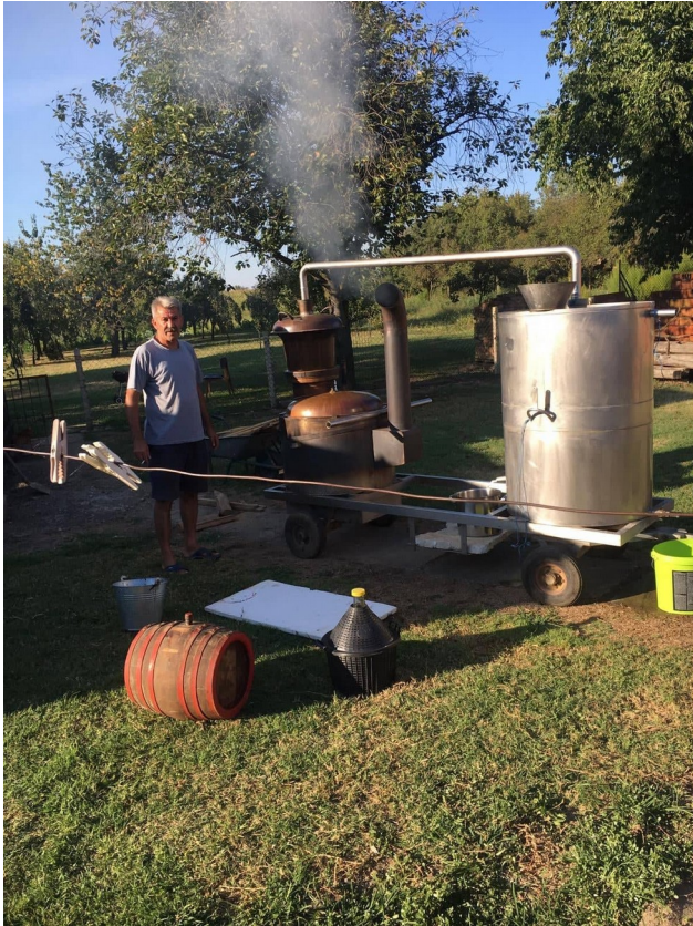
Slika 10. Pečenje rakije – Stari Mikanovci