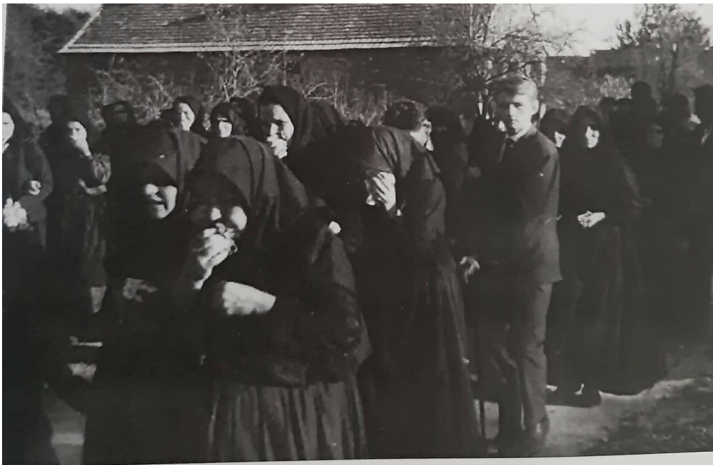
Slika 18. Ukopnici, Stari Mikanovci ( Raić, 2016:145)