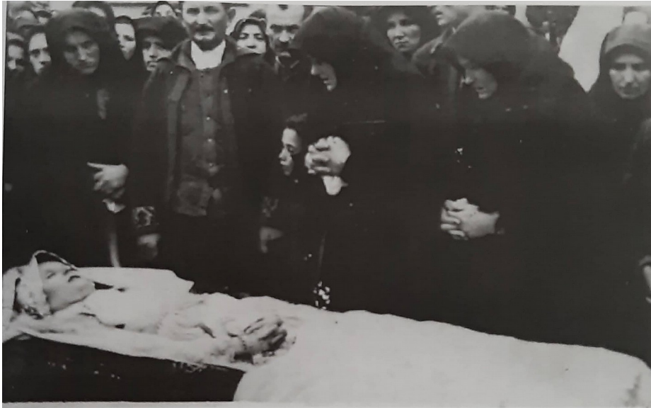
Slika 17. Sprovod mlade snaše iz kuće Petričević, Stari Mikanovci (Raić, 2016: 145)