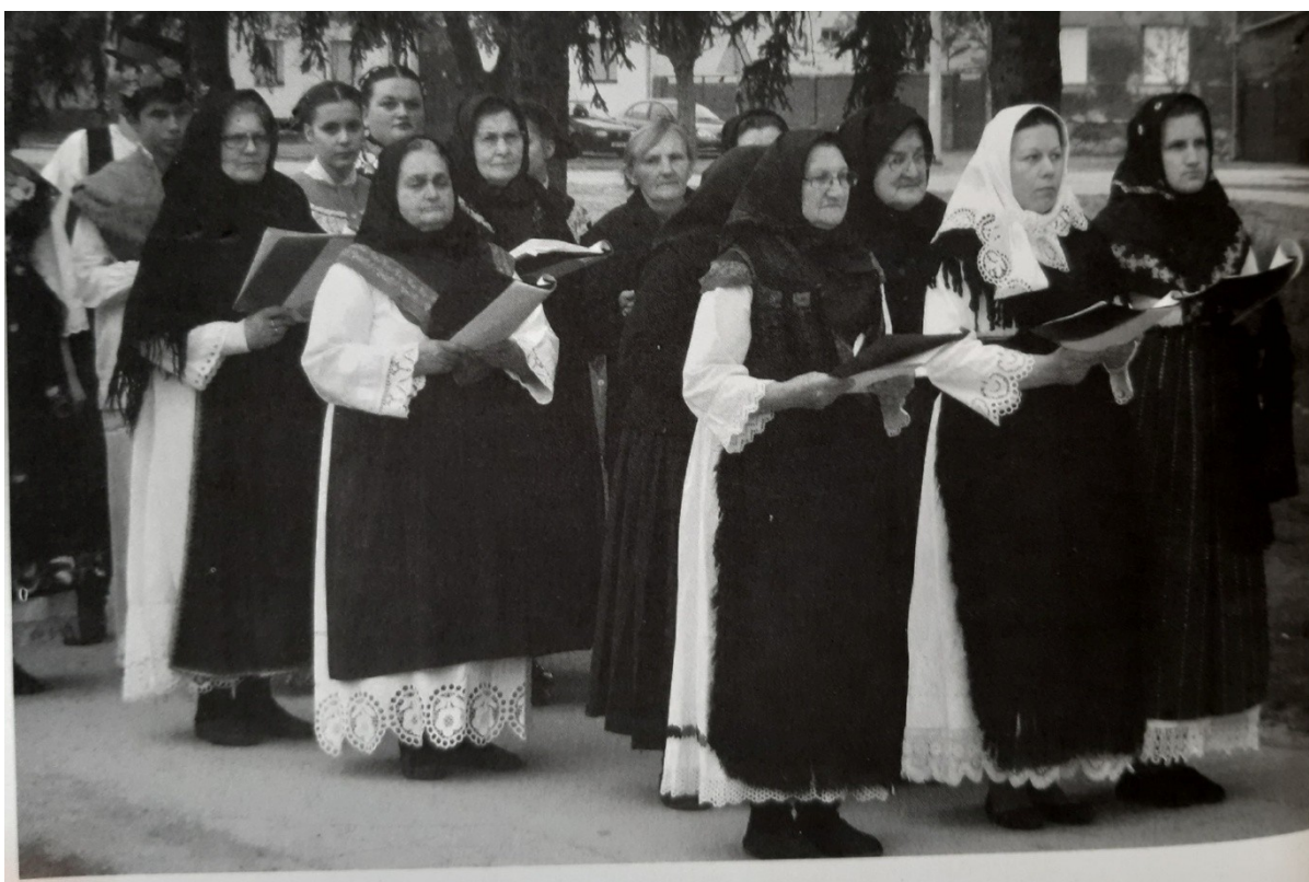
Slika 2. Počimajle na Križnom putu ( Svirac, 2016: 36 )

U Vođincima su Vođinačke počimajle pjevale pučke crkvene pjesme Sveta Djevo Marijo , Gospin plač i Isukrst nam slavni . Pjevao se i Križni put , Na čast uskrsnuloga .