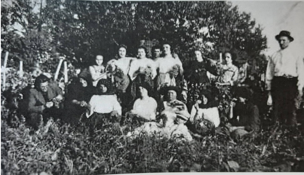
Slika 12. Berba grožđa u Starim Mikanovcima (negdje prije pedesetih godina 20.stoljeća)