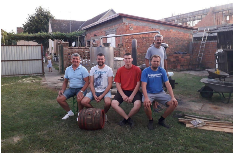
Slika 9. Pečenje rakije – Stari Mikanovci – vlastiti album