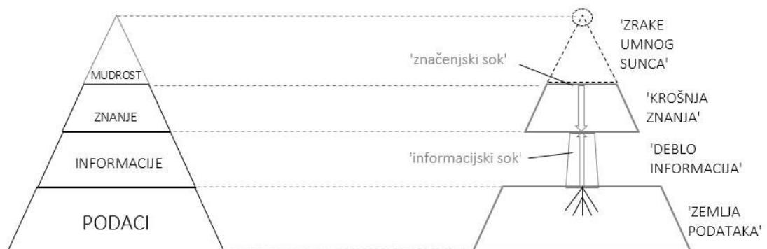
Slika 1 – Dinamički simbol DIKW hijerarhije u obliku Stabla znanja 26