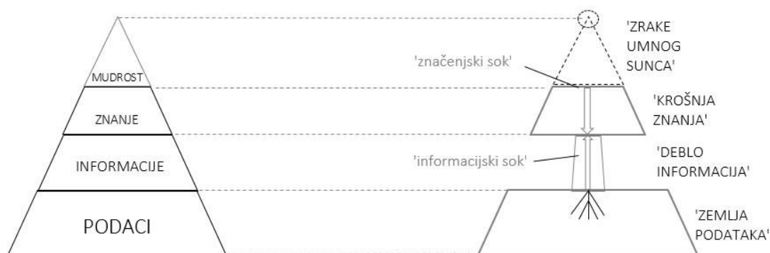
Slika 1 – Dinamički simbol DIKW hijerarhije u obliku Stabla znanja 26