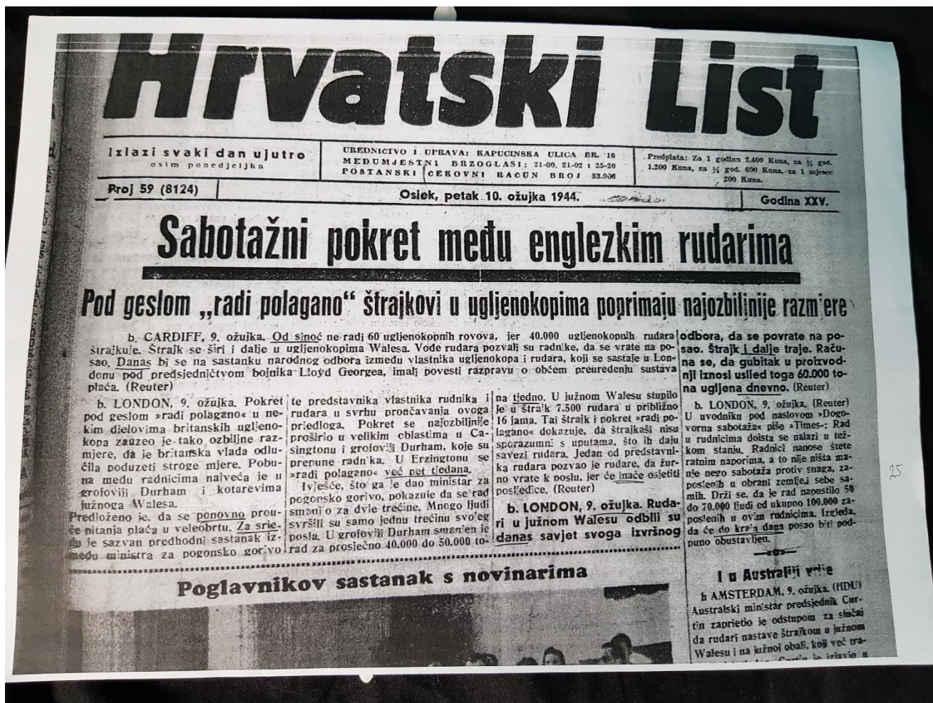
Slika 5. Hrvatski list, 10. ožujka 1944.