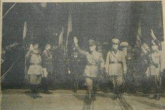
POGLAVNIK DR. ANTE PAVELIĆ ULAZI NAJAVNICE KOLEDOVAK. PRAČIN IZ ULAZA ČLANA G. KULENOVIĆA

Zagreb, 16. lipnja. Danas u 16.22 sat doputovao je po- glavnik u Zagreb iz Mletaka u Zagreb Poglavnik dr. Ante Pavelić u prvi sposobnosti prije dolaska u Zagreb je u Mletcima, gdje je potpisao trojni pakt, bio u velikoj slavi. Poglavnik je u prvi sposobnosti prije dolaska u Zagreb je u Mletcima, gdje je potpisao trojni pakt, bio u velikoj slavi. Poglavnik je u prvi sposobnosti prije dolaska u Zagreb je u Mletcima, gdje je potpisao trojni pakt, bio u velikoj slavi.