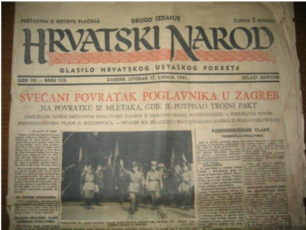
Slika 3. Hrvatski narod, 17. lipnja 1941.