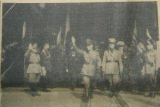
POGLAVNIK DR. ANTE PAVELIĆ UPRVI SPOSOBNOSTI PRIJE DOĐAVKA U ZAGREB NA MANIFESTACIJE, ČIME JE POTPUNO OSTVARIO SVE CILJEVE KOJE JE POSTAVIO PRI ODLASKU U MLETAKE I KOJI SU OSTVARENI U POTPUNOSTI.

ČLANOVI HRVATSKE VLADÉ DOČEKUJU POGLAVNIKA Poglavnik dr. Ante Pavelić u prvi sposobnosti prije dolaska u Zagreb na manifestacije, čime je potpuno ostvario sve ciljeve koje je postavio pri odlasku u Mletaku i koji su ostvareni u potpunosti.