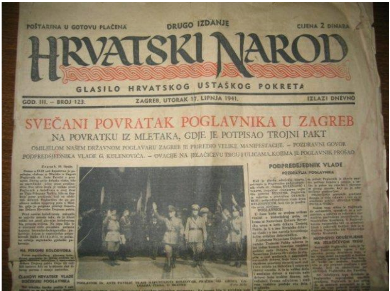
Slika 3. Hrvatski narod , 17. lipnja 1941.