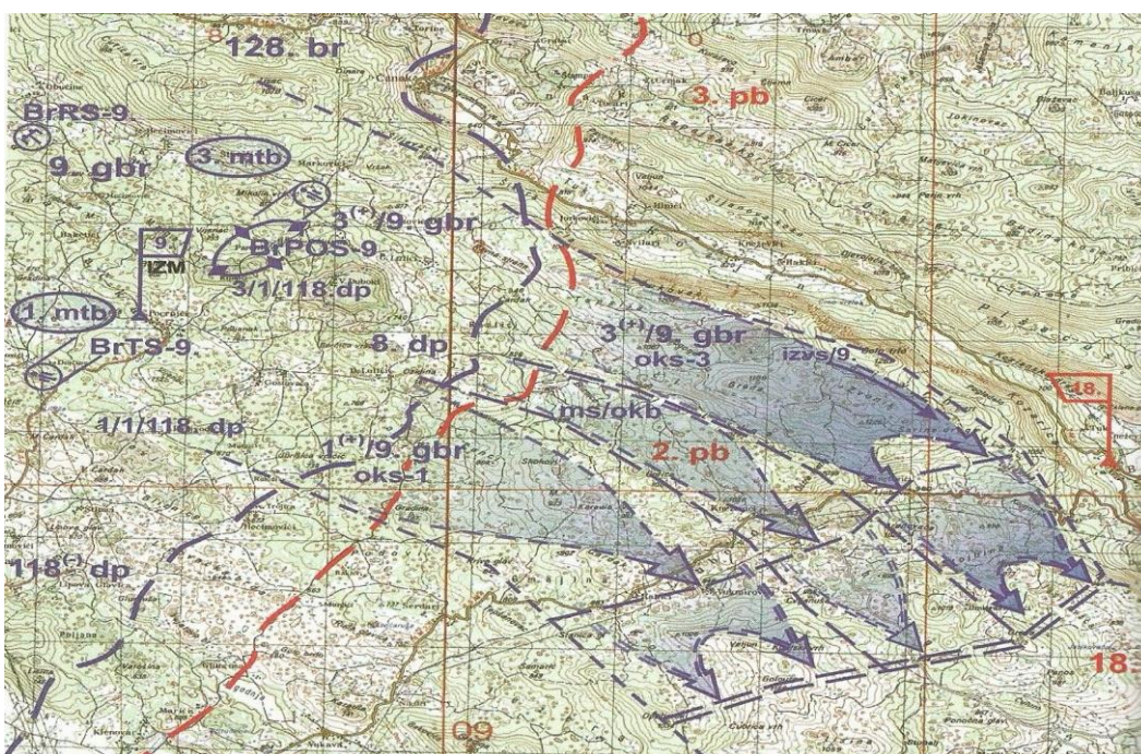
Slika 1 13 . Plan napada 9. Gardijske brigade HV „Vukovi” na ličkom dijelu bojišta

Planiranje vojno-redarstvene operacije „Oluja” provodilo se za sav okupiran teritorij Republike Hrvatske po zbornim područjima 10 . Nadležnosti zbornoga područja jesu vojno-teritorijalne (mobilizacija ljudi i materijalnih sredstava, novačenje, rad pozadinskih službi u potpori manevarskih snaga koje provode borbena djelovanja), ali i zapovjedno-operativne s obzirom na teritorijalno pripadajuće postrojbe i to sagledavajući kompletnu situaciju na terenu, stanje neprijateljskih snaga (ljudstva, materijalnih sredstava i borbene tehnike) te situaciju u Bosni i Hercegovini. Za potrebe provedbe operacije „Oluja” ustrojena su sljedeća zborna područja: ZP Bjelovar, ZP Zagreb, ZP Karlovac, ZP Gospić i ZP Split 11 . Planovi za operaciju „Oluja” su stalno dopunjavani i usavršavani od 1992. do 1994. godine u ovisnosti od stanja na terenu. 12 Konačni plan provedbe vojno-redarstvene operacije „Oluja” izrađen je i usuglašen nekoliko dana prije početka operacije „Oluja”.