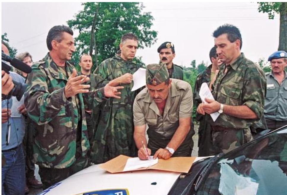
Slika 3. Predaja 21. kordunskog korpusa

Ministar obrane Gojko Šušak 08. kolovoza 1995. godine obratio se hrvatskoj javnosti i objavio da je vojno-redarstvena operacija „Oluja” završena 7. kolovoza 1995. godine u 18,00 sati 45 .