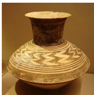
Slika 1. Glinčarija iz Tell-es – Šeiha