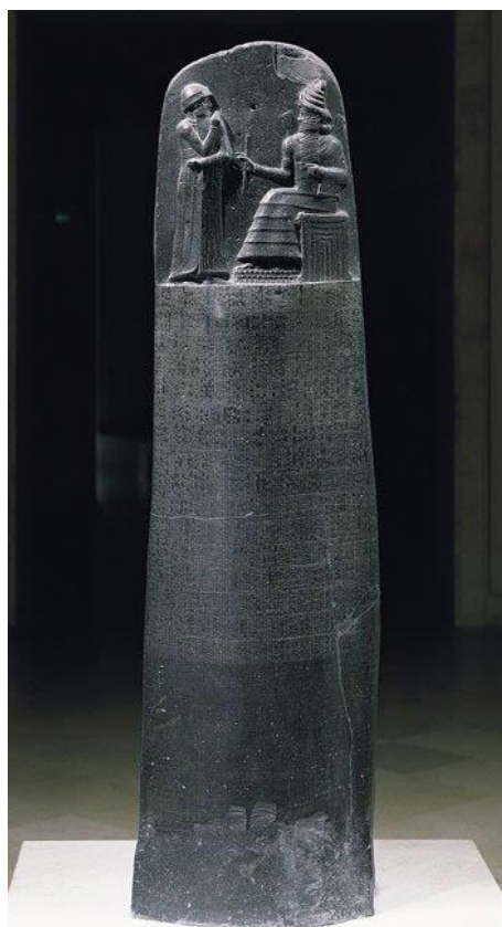
Slika 2. Hamurabijev zakonik