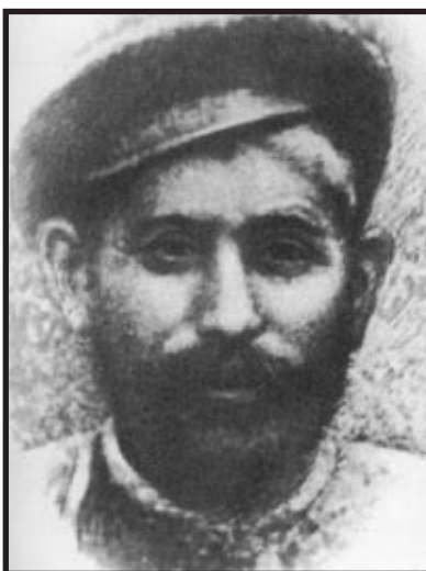
Visarion Džugašvili, Staljinov otac

Staljin je djetinjstvo proveo u istoj onoj bijedi u kojoj je rođen. Njegov otac Visarion pokušao se uspeti na razinu nižeg srednjeg staleža, ali nije uspio. Kao postolar premalo je zarađivao pa je i Ekaterina morala puno raditi. Visarion se propio te je i ono malo što je zaradio trošio na votku. Postoje tvrdnje i da je bio grub i okrutan prema ženi i sinu, to je zasigurno ostavilo traga na Staljinovu karakteru. «Strašne batine koje nije zaslužio učinile su dječaka jednako mračnim i okrutnim kakav mu je bio otac. Od očeve okrutne bezosjećajnosti branio se sumnjičavošću, nepovjerenjem, budnošću, oprezom, laganjem, pretvaranjem i izdržljivošću.» (Deutscher, 1967: 21). Kad je propao kao samostalan obrtnik, Visarion je napustio i obitelj i Gori te otišao u Tbilisi gdje se zaposlio kao radnik u tvornici cipela. Čini se da je to doživio kao veliko poniženje. Htio je postati vlastiti gazda, a postao je nadničarski rob. Vjerojatno je to razlog