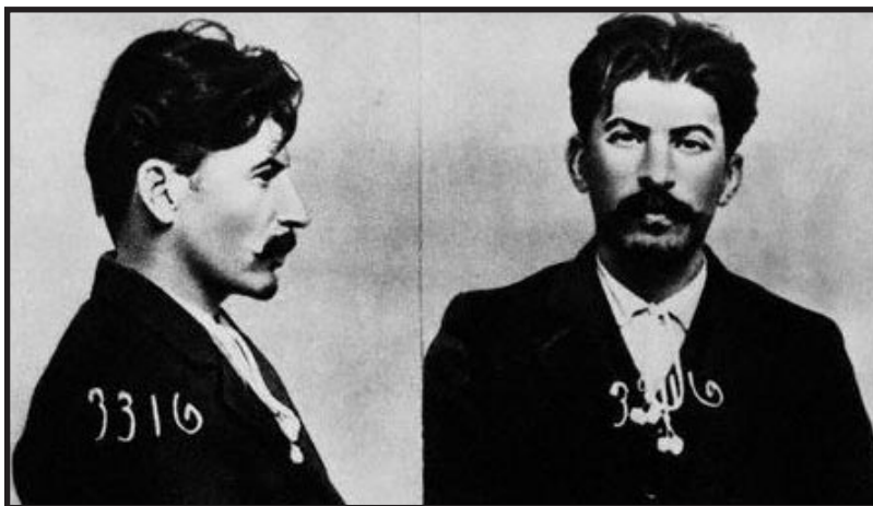
Staljinova fotografija nakon uhićenja (1911.)

zajednička svim njegovim manifestacijama, je strast za posjedovanjem apsolutne i neograničene vlasti nad živim bićem, bilo životinjom, djetetom, ženom ili muškarcem.» (Fromm, 1986.: 117). Jedan od najcjenjenijih psihologa dvadesetog stoljeća Erich Fromm uopće ne sumnja u tvrdnju da je Staljin bio sadist. On u svom djelu Anatomija ljudske destruktivnosti spominje Staljina kao klasičan primjer neseksualnog, mentalnog i fizičkog sadizma. Staljin je često osobno izdavao naređenja o vrsti mučenja koju treba primijeniti na zatvoreniku.