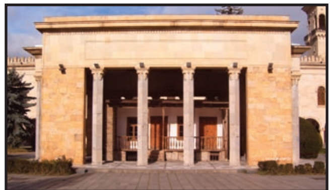
Staljinova rodna kuća u Goriju, Gruzija

Staljinov otac Visarion Ivanovič Džugašvili, oko 1875. godine napustio je selo Didi-Lilo, nedaleko od Tbilisija te se naselio u gruzijskom općinskom središtu Goriju. Tamo je otvorio malu postolarsku radionicu. On je bio sin gruzijskih seljaka, koji su samo deset godina prije njegovog rođenja još bili kmetovi. U Goriju se oženio djevojkom sličnog skromnog podrijetla, Ekaterinom Geladze, čiji je otac bio kmet Grigorij Geladze iz sela Gambareuelija. Ona je, vjerojatno, kao kći siromašnih seljaka došla u grad da bi se zaposlila kao sluškinja u nekoj armenskoj ili ruskoj obitelji srednjeg staleža. Kada se udala, Ekaterina je imala svega petnaest godina. Unajmili su bijednu kućicu na samom rubu Gorija i plaćali za nju rubalj i pol mjesečno. «Kućica