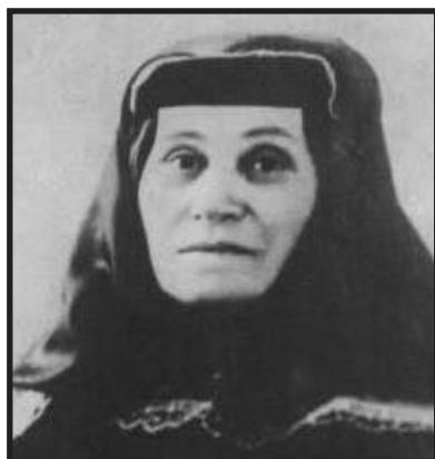
Ekaterina Džugašvili, Staljinova majka

Svu nježnost, koju je posjedovala, namijenila je jedinom preživjelom djetetu. Bila je duboko pobožna, i vjera i crkva bijahu za nju jedina utjeha u svakoj patnji i nesreći. Bila je osim svega još i nepismena, i tek je u starosti naučila čitati i pisati, uradivši to samo zato da tako pokaže kako je dostojna majka svoga slavnog sina. Svi koji su je poznavali divili su se njezinom smirenom, suzdržljivom dostojanstvu, koje neki ljudi steknu nakon dugog života provedenog u brigama, ne dopuštajući da im gorčina zbog takvog života zamrlja karakter.» (Deutscher, 1967: 22).