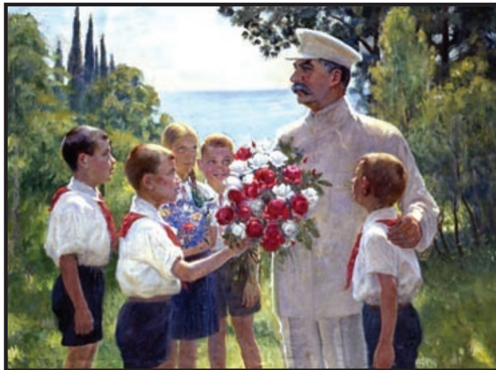
Ruže za Staljina (1949.)

Kad god se razmišlja o diktatorima i totalitarnim režimima, čovjek se uvijek zapita kako je tim diktatorima i vođama uspjelo zavesti tolike narodne mase da ih bespogovorno slijede bez obzira koliko njihove radnje bile nemoralne, nenormalne i neljudske. Fromm u svom djelu Autoritet i porodica iznosi mišljenje da je to zato što autoritarno društvo stvara i zadovoljava one potrebe koje rastu na osnovi sadomazohizma. Zadovoljenje koje počiva u mazohizmu negativne je i pozitivne vrste. Negativno, kao oslobođenje od strepnje, odnosno