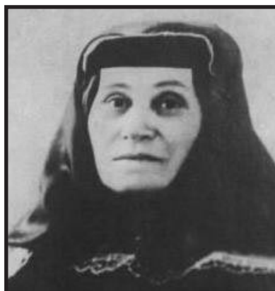
Ekaterina Džugašvili, Staljinova majka

Svu nježnost, koju je posjedovala, namijenila je jedinom preživjelom djetetu. Bila je duboko pobožna, i vjera i crkva bijahu za nju jedina utjeha u svakoj patnji i nesreći. Bila je osim svega još i nepismena, i tek je u starosti naučila čitati i pisati, uradivši to samo zato da tako pokaže kako je dostojna majka svoga slavnog sina. Svi koji su je poznavali divili su se njezinom smirenom, suzdržljivom dostojanstvu, koje neki ljudi steknu nakon dugog života provedenog u brigama, ne dopuštajući da im gorčina zbog takvog života zamrlja karakter.» (Deutscher, 1967: 22).