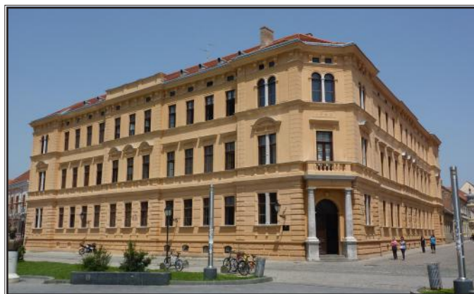
Zgrada Realne gimnazije (danas III: gimnazija)