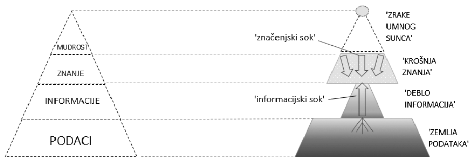
Slika 3. Dinamična inačica DIKW-hijerarhije – DIKW-stablo ili „stablo znanja“.

Sloj mudrosti u statičnoj slici DIKW-modela pretvorio se u „umno sunce“ dinamičnog DIKW-modela odgovorno za stvaranje još jednoga gradivnog elementa nužnog za rast znanja – „značenjskog soka“. Informacijski i značenjski sok u metaforičnom smislu tako predstavljaju jedinu energiju koja ulazi u sustav „stabla znanja“ omogućujući njegov rast. Ta metaforična slika (i simbol), osim što ukazuje na činjenicu da informacija i značenje ne mogu biti jedan te isti fenomen, čini informaciju vidljivom u cijelom procesu stjecanja znanja, što je u stvarnosti teško ostvariti. Iako subjektivna, jer se nalazi unutar „stabla znanja“, informacija u sebi može nositi i nešto objektivno. 81 Nemetaforičnim jezikom rečeno, premda se jedino može percipirati kao unaprijed kodirana (u prijenosu) i sa značenjem (ugrađena u strukturu znanja), informacija nas na svoj način informira o onome što dolazi izvan našeg kognitivnog sustava.