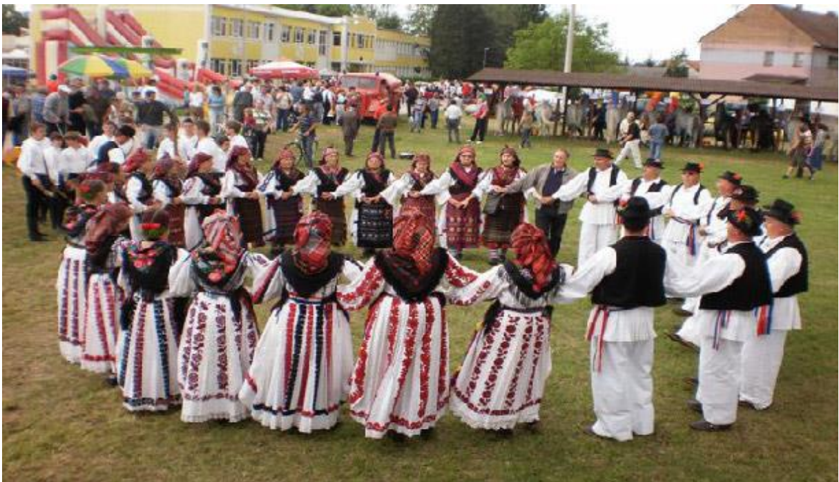
11. Brodsko kolo

Svatovi se kite ružmarinom, A mladenci dogodine sinom! 60