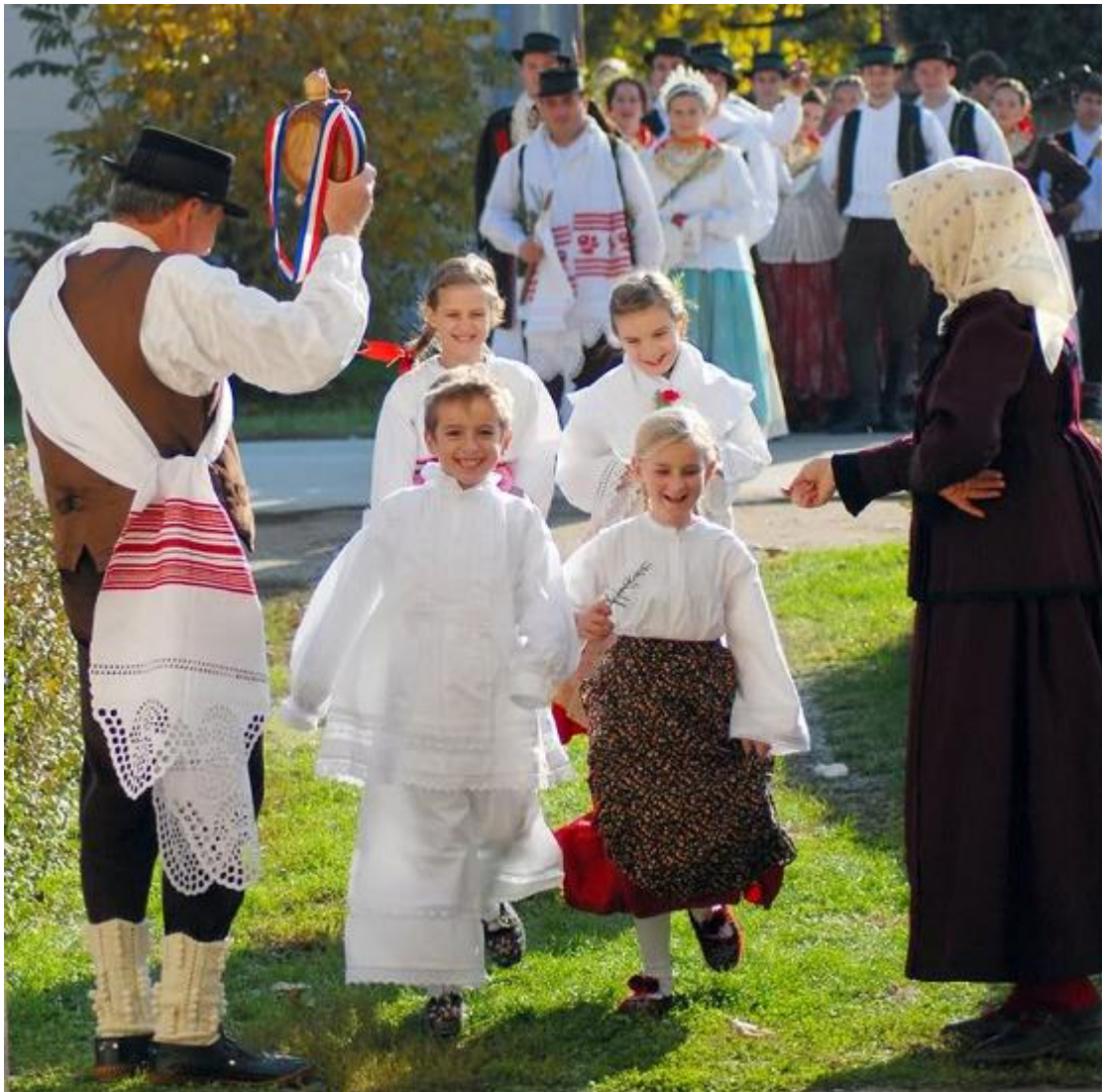
4. Šokački svatovi

Svatovima se u najširem smislu, posebice u novije vrijeme, nazivaju svi sudionici svadbe. U prvotnom smislu svatovi su bili glavni sudionici svadbe, oni s posebnim dužnostima, npr. stari svat, djeverovi i sl. (Vitez 1998: 168-169)