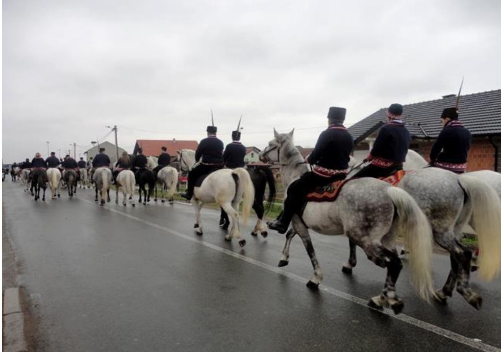
10. Fotografija prikazuje pokladno jahanje u selu Ruščica 2014. godine

Vrijeme održavanja poklada, dakle prijelazno razdoblje iz zime u proljeće, ima svoju magijsko-simboličnu važnost. Vjerovalo se da čovjek određenim postupcima može utjecati na prirodu za svoju dobrobit te je to jedno od polaznih etnoloških tumačenja drevnog smisla i funkcija pokladnih običaja. Vitez navodi da je prema tim tumačenjima odlučujuća bila uloga zaštitne (apotropejske) magije i magije za plodnost koja se nazire iza mnoštva regionalno i lokalno različitih pokladnih postupaka i likova. Današnje poklade imaju smanjenu magijsku funkciju u odnosu na blisku prošlost, posebno u urbanim sredinama; magijska funkcija je uvijek bila snažnija u seoskim sredinama. (Vitez 1998: 199-200)