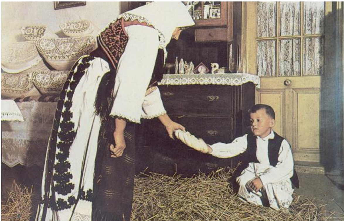
5. Dječak na položaju

Muška djeca uđu u kuću i čućnu za vrata te potom izgovaraju čestitku. Djeca su na ovaj način zapravo blagoslivljala kuću domaćina. Nakon toga bi domaćin prigodno darivao djecu u znak zahvale i to ponekad novcem, kobasicom oko vrata, bombonima... Ženska djeca nisu izlazila iz kuće dok ne prođe položaj jer je u narodu postojalo vjerovanje da ženska djeca donose nesreću, a muška sreću. Tek kada bi se blagoslovile sve kuće ženska djeca su mogla ići u goste .