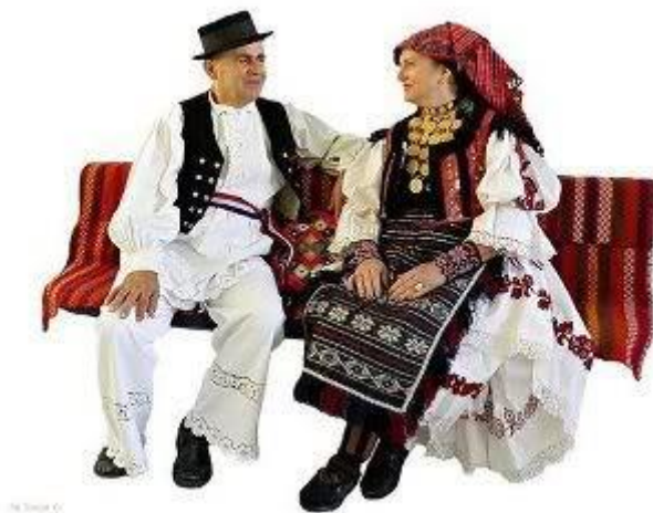
3. Šokac i Šokica odjeveni u nošnje

Košulja i gaće kao temelj muške odjevne sheme u ljetnom modalitetu imaju istodobno i svojstvo i donjeg i gornjeg ruha. Osnovnoj odjeći može se pribrojiti i prsluk koji obično seže do struka. Pojas nije obavezni dio nošnje, ali se često stavi i to najčešće bude traka trobojnica. Zimski je modalitet sadržavao lače 17 izrađene od tanjeg vunenog sukna, kraće i duže ogrtače, krznene prsluke ili kožuhe s rukavima, čizme umjesto opanaka te šešir ili šubaru od janječeg krzna. (Muraj 1998: 136)