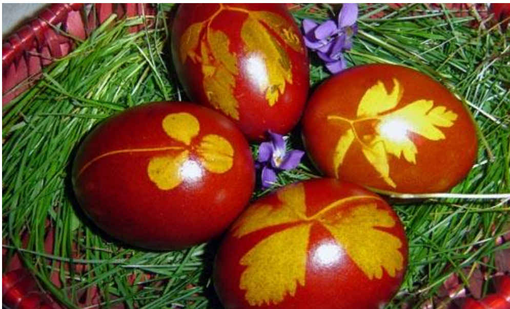
8. Uskrsne pisanice obojane bojom dobivenom od ljuske crvenoga luka

generacije još uvijek koriste prirodne boje dobivene od ljuske luka ili cikle. Kazivačica Ana kaže: većinom se farbalo sa lukom, neki su pravili i od cikle. Mi smo metali samo kuvat luk. Najprvo se nakida ljuska crvenog luka i to se skuva i dobije boja. Jaja se posebno skuvaje i onda meću u ofarbanu vodu. Nabere se djeteline, ljepog lišća, maslačaka i to se stavi na jaje i umota u najlonku da ostane slika. Kad je gotovo premaže se slaninom da se fino sjaje.