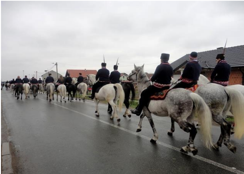
10. Fotografija prikazuje pokladno jahanje u selu Ruščica 2014. godine

Vrijeme održavanja poklada, dakle prijelazno razdoblje iz zime u proljeće, ima svoju magijsko-simboličnu važnost. Vjerovalo se da čovjek određenim postupcima može utjecati na prirodu za svoju dobrobit te je to jedno od polaznih etnoloških tumačenja drevnog smisla i funkcija pokladnih običaja. Vitez navodi da je prema tim tumačenjima odlučujuća bila uloga zaštitne (apotropejske) magije i magije za plodnost koja se nazire iza mnoštva regionalno i lokalno različitih pokladnih postupaka i likova. Današnje poklade imaju smanjenu magijsku funkciju u odnosu na blisku prošlost, posebno u urbanim sredinama; magijska funkcija je uvijek bila snažnija u seoskim sredinama. (Vitez 1998: 199-200)