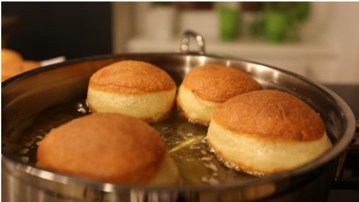
9. Pečenje pokladnih krofni

Pokladno doba godine karakterizira maskiranje, igra, zabava, jelo, piće, društvena kritika, seksualna pobuna te traženje vlastitih korijena u tradicijskoj kulturi zavičaja. (Lozica, Rajković, Supek-Zupan: 537-538) U brodscome kraju za vrijeme poklada jede se sušeno meso, kobasice, čvarci, švargl , a od slastica su najčešće krofne punjene pekmezom pržene na masti, ali i masnice s orasima ili makom.