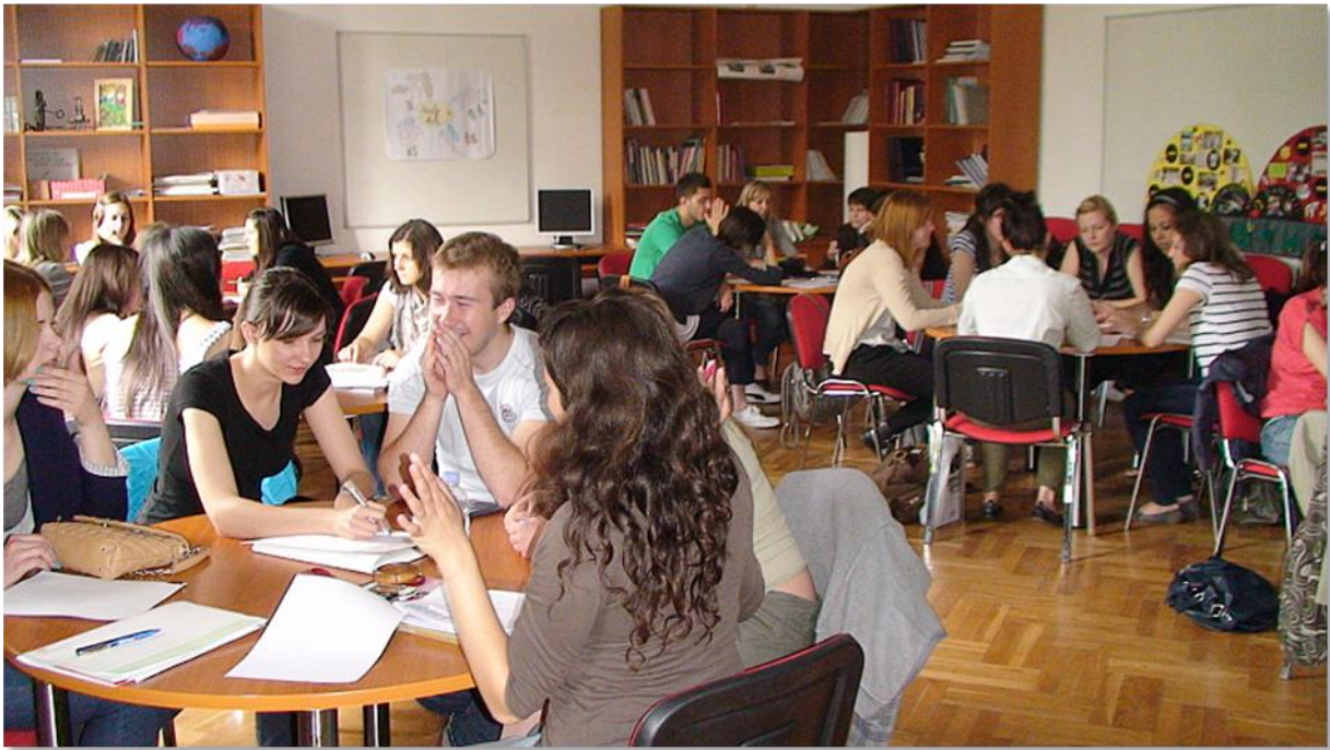
Slika 1. Učionica za nastavu pedagogije

Osijeku. Učionica je prilagođena suradničkom učenju studenata, čemu posebno pridonose okrugli stolovi (slika 1).