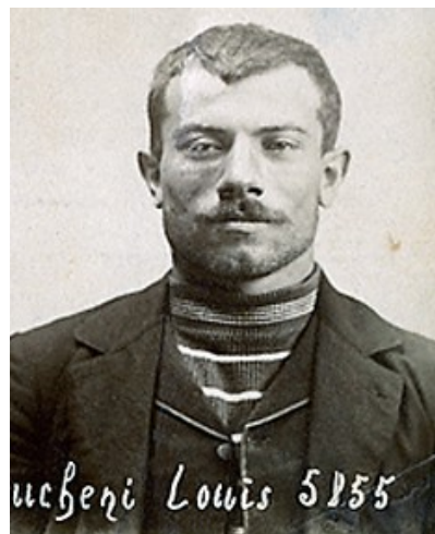
Slika 7. Luigi Luccheni (1873.-1910.), talijanski anarhist i ubojica ugarsko-hrvatske kraljice Elizabete 1898. godine.

Osječki kapucini spominju da se 10. rujna 1898. "zbio strašan zločin" kada je talijanski anarhist Luigi Luccheni ubio austrijsku caricu Elizabetu. 217