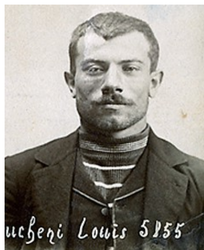
Slika 7. Luigi Luccheni (1873.-1910.), talijanski anarhist i ubojica ugarsko-hrvatske kraljice Elizabete 1898. godine.

Osječki kapucini spominju da se 10. rujna 1898. "zbio strašan zločin" kada je talijanski anarhist Luigi Luccheni ubio austrijsku caricu Elizabetu. 217