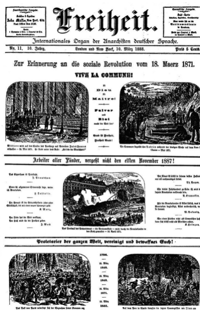
Slika 8. List Freiheit (pokrenut 1879.) kojeg je uređivao Johann Most (1846.-1906.), njemački anarhist i zagovornik revolucionarnog terorizma. Pretpostavlja se da je kružio i među hrvatskim radništvom. Naslovnica od 10. ožujka 1888. godine.