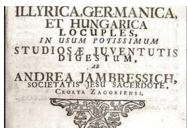
Slika 3. Naslovna strana Lexicona

Dvije godine nakon izlaska Belostenčeva rječnika, u Zagrebu je 1742. tiskan i drugi veliki kajkavski rječnik pod naslovom Lexicon latinum interpretatione illyrica, germanica et hungarica locuples, in usum potissimum studiosae juventutis digestum, ab Andrea Jambressich, societatis jesu sacerdote, croata zagoriensi . Iz naslova rječnika očigledno je kako je riječ o četverojezičnom latinskom rječniku s prijevodom na ilirski, njemački i mađarski jezik, da je namijenjen „školskoj i učenoj mladeži“ te da ga je priredio Hrvat-Zagorac Andrija Jambrešić, svećenik Družbe Isusove. Rječnik ima 1068 stranica i broji oko 27 000 riječi.