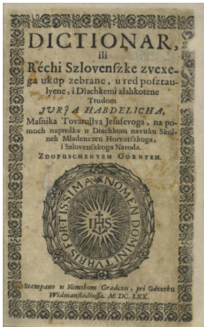
Slika 2. Naslovna strana Habdelićeva Dictionara

Habdelićev je Dictionar prvi hrvatski kajkavski rječnik, a njime zauzima istaknuto mjesto u povijesti hrvatskog jezikoslovlja. Rječnik je hrvatsko- talijanski i pisan za školske potrebe, namijenjen da kao školski udžbenik za latinski jezik služi cijeloj sjevernoj Hrvatskoj. Ponajprije se to odnosilo na škole isusovačkih kolegija, budući da je Habdelić bio isusovac. Dikcionar je malog, džepnog formata. Tiskan je u Grazu 1670. i opsegom nije velik: broji oko 12 000 riječi na sveukupno 460 stranica. Na prvih šest stranica rječnika nalazi se posveta upućena potomcima glasovite plemićke obitelji Auersperg, koja je tada bila dobročinitelj isusovačkih kolegija u Zagrebu i Varaždinu. Na dnu svake stranice u desnom uglu nalazi se kustoda, tj. prva riječ ili slog naredne stranice. Habdelićev izraz Slovenski u naslovu rječnika zapravo je poekavljeni lik pridjeva slovinski , što znači jezik hrvatski (kajkavski). Na kraju rječnika, u Appedixu zabilježeni su: rimski kalendar, razne vrste brojeva, tablica množenja i na kraju ispravci. Brojevi su napisani arapskim brojkama kao glavnim brojevima i s točkom što bismo danas čitali kao redne brojeve. Nakon brojke slijedi zapis broja na hrvatskom jeziku, prijevod na latinski i još jedan zapis tog broja rimskim brojkama. Uz tablicu množenja brojeva do 100, koju Habdelić unosi pod naslovom: Tabula na polehchiczu onem ki tesko rachune chine , dodan je i tekst s uputama kako se služiti tablicom množenja. Na kraju