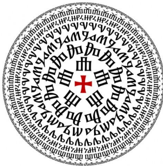
Slika 2. Glagoljica u grafičko-dizajnerskome izdanju Nikole Đureka

Prema tome, glagoljična su pismena i jezični znakovi i slike jer je svaki znak slika, a svaka slika ima određeno značenje. Dalo bi se govoriti o velikoj umjetničkoj vrijednosti glagoljičnoga pisma jer ono je dio genijalnoga uma koji je, jasno, morao imati i znanje i smisao za umjetnost. Sastaviti takvo pismo nije bio nimalo lak zadatak jer svako je slovo savršena cjelina koja ima pokriće u likovnosti, filologiji, filozofiji, gramatologiji, grafolingvistici, pa čak i u religijskim ideologijama.