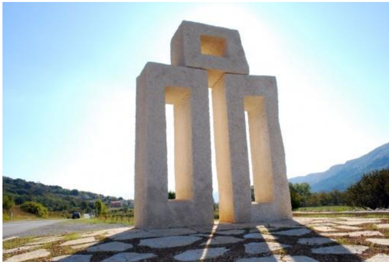
Slika 1. Bašćanska Staza glagoljice na otoku Krku, glagoljično slovo L .

Dakle, glagoljica jest pismo sastavljeno, kao i svako drugo, od pismena ili slova. Ali razlog njezina opstanka leži u lakoći uporabe i prosvjetljenosti Konstantina Filozofa koji je, osim teorijskoga znanja o pismima, imao i duhovno znanje i dar prenošenja istoga svojim suvremenicima da bi glagoljica opstala u svoj svojoj ljepoti do današnjih dana. Svako glagoljično slovo ne samo da je slovo već je i znak i brojčana oznaka. A svaki znak nije samo znak već je i slika. Slika s posebnom umjetničkom vrijednošću. O tome će biti riječi u nastavku teksta.