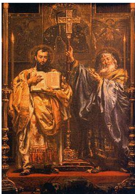
Slika 3. Sveta Braća – Ćiril i Metod; s lijeve je strane Konstantin

Već smo ustvrdili da su glagoljična slova imenovana, međutim manje je poznato da ta imena slova daju smislenu poruku pa az buky vede glagolj dobro est živetí 3elo zemli (dakle nazivi za početak azbuke: a, b, v, g, d, e, ž, 3, z ) poručuju: ja koji znam slova govorim da je dobro živjeti na zemlji 20 . Poruka je posve kršćanska, u skladu sa svjetonazorom tvorca glagoljice Konstantina Filozofa čiji nam nadimak Filozof kazuje da se uspješno bavio filozofijom, koju je tada predavao na najvažnijoj školi na Istoku – Magnauri 21 . I sâm Konstantinov nadimak – Filozof nameće nam proučavanje glagoljice s toga stajališta.