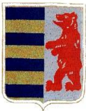
Slika 2. Grb Rusnaka - prikazuje crvenog medvjeda okrenutog prema plavim i zlatnim linijama

Rusini (Rusnaci, Ruteni) su maleni narod iz grupe istočnih Slavena čija se stara postojbina nalazila u Prikarpatskoj Rusiji, odnosno dijelu Ukrajine, na granici s Poljskom, Slovačkom, Mađarskom i Rumunjskom. Članovi ovoga naroda, njih milijun i pol, žive u raznim europskim državama, te u Americi i Australiji. Migracije Rusina počele su u 14. st. i to najprije iz Zakarpatja i Karpata u Potkarpatje, a kasnije i u mađarska sela. Danas ih je u Europi najviše u Karpatskom području i to u jugozapadnoj Ukrajini, sjevernoj i sjeveroistočnoj Slovačkoj, na sjevernim padinama Karpata, u jugoistočnoj Poljskoj, u dijelu sjeverne Rumunjske, u nekoliko sela južno od rijeke Tise u oblasti Maramures, u nekoliko raštrkanih naselja sjeveroistočne Mađarske. Osim u postojbini, žive i u Vojvodini, zapadnom Srijemu, istočnoj Hrvatskoj, u Pragu i sjevernoj Mađarskoj. Riječ Rusnak/Rusin dolazi od riječi Rus, s dodatkom -in je Rusin, a -njak Rušnjak. 7 Na mađarskom je jeziku Rusnyak prema Rusnak u prikarpatskoj Rusiji. Tradicionalni zapadni znanstvenici tvrde da ime Rus potječe iz staroga naroda skandinavskoga podrijetla Varangiana koji se preselio južno od baltičke obale i osnovao prvu državu među istočnim Slavenima, sa središtem u Kijevu. U prilog ovoj teoriji ide grb Rusnaka. Grb je prihvaćen 30. ožujka 1920. godine kao grb provincije Potkarpatska Rus u Čehoslovačkoj.