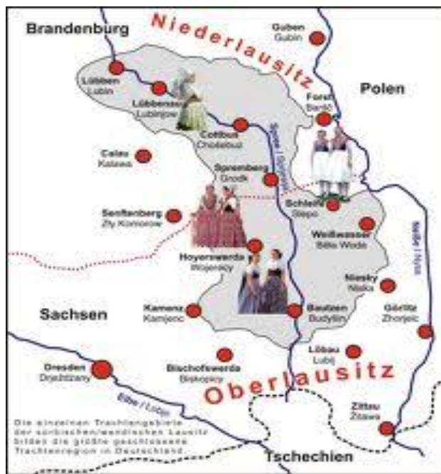
Slika 3. Područje Gornje i Donje Lužice

Time su postojana i dva književna jezika: gornjolужиčkosrpski književni jezik i donjolужиčkosrpski književni jezik. Gornjolужиčkosrpski jezik prema svojim je obilježjima sličniji češko-slovačkom jeziku, dok je donjolужиčkosrpski bliži lehitskim jezicima.