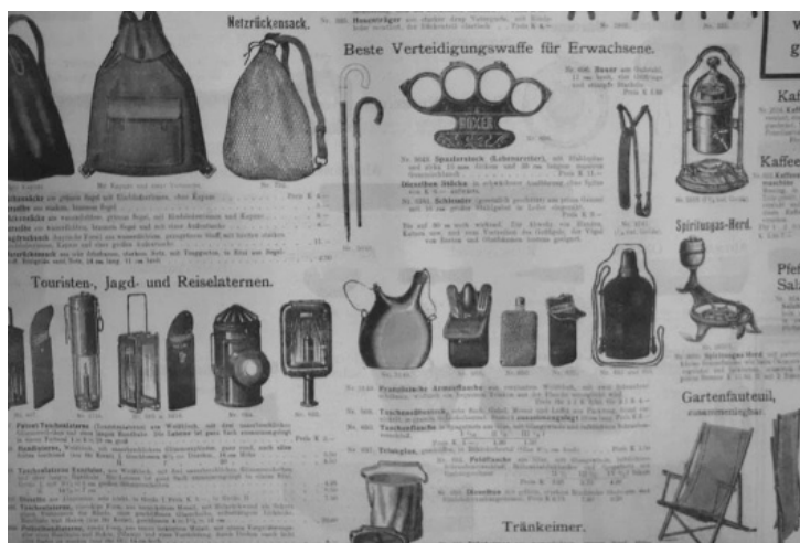
Slika 3. Oglasi u novinama „Die Drau“, izdanje od 15. veljače 1908.

Do početka Prvoga svjetskog rata novine su nastavile s praksom mijenjanja postojećih rubrika i uvođenja novih. Pojavljuju se, primjerice, rubrike Inland , Ausland , Theater , Kunst und Literatur itd., no često premještanje rubrika govori kako se one još uvijek formiraju i razvijaju. Godine 1907. novine „Die Drau“ postaju dnevni list, no važnijih sadržajnih promjena nije bilo. Godine 1908. u reklamama se počinju pojavljivati fotografije, ilustracije i karikature (v. sliku 3).