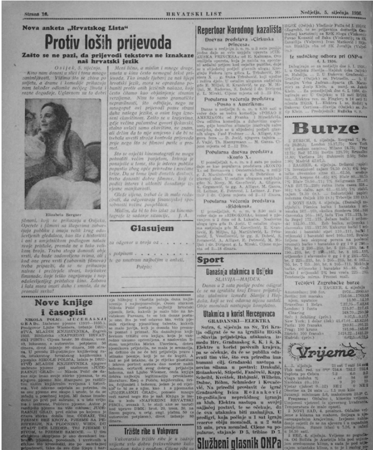
Slika 2. Rubrike u „Hrvatskom listu“, izdanje od 5. siječnja 1936.

Novine „Die Drau“ pregledane su od prve do zadnje godine izlaza, 1 a analizirano je 98 brojeva. Novine „Slavonische Presse“ pregledane su od druge godine izlaza, 2 tj. 1886., do 1917. godine, a analizirano je 56 brojeva. Novine „Narodna (Hrvatska) obrana“ pregledane su od prve do zadnje godine izlaza, a analizirano su 34 broja. Naposljetku, analizirano je 39 brojeva „Hrvatskog lista“, objavljenih također od prve do zadnje godine izlaza. Sveukupno je, dakle, analizirano 227 pojedinačnih brojeva izdanja četiriju novina u razdoblju od 1868. do 1945. godine, a posebna se pozornost pridala rubrikama, njihovom sadržaju, mijenjanju naziva rubrika, grafičkom oblikovanju i