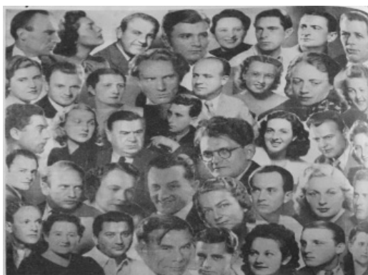
Slika 8. „Osječko kazalište u novoj godini“, fotomontaža u „Hrvatskom listu“, izdanje od 1. siječnja 1941.

„Hrvatski list“ razlikuje se od prijašnjih novina ponajprije širenjem sadržaja i, slijedom toga, broja rubrika posvećenih razonodi, što je dijelom odraz uredničke politike, a dijelom vremena u kojem su objavljivane. Rubrike koje se najčešće pronalaze su Politički pregled , Iz života i svijeta , Širom Slavonije , Najnovije vijesti , Gradske vijesti i Društvene vijesti .