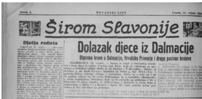
Slika 6. Rubrika Širom Slavonije u „Hrvatskom listu“, izdanje od 25. veljače 1936.

Promjena vizualnog izgleda rubrika od 1927. godine očituje se u naglašavanju imena pojedine rubrike. To je postignuto negativom ili oslikavanjem područja zaglavlja naslova (v. sliku 5) ili drugim načinima isticanja (v. sliku 6) – tako da je naziv iste rubrike katkad grafički različito rješavan. Često se unutar prijeloma pojavljuje jednostupčana ilustracija, karikatura, skica ili strip koji prekida tijek čitanja i usmjerava čitateljevu pažnju. Stupci teksta počinju se odvajati horizontalnim tankim linijama i takav izgled novine zadržavaju do kraja izlaženja.