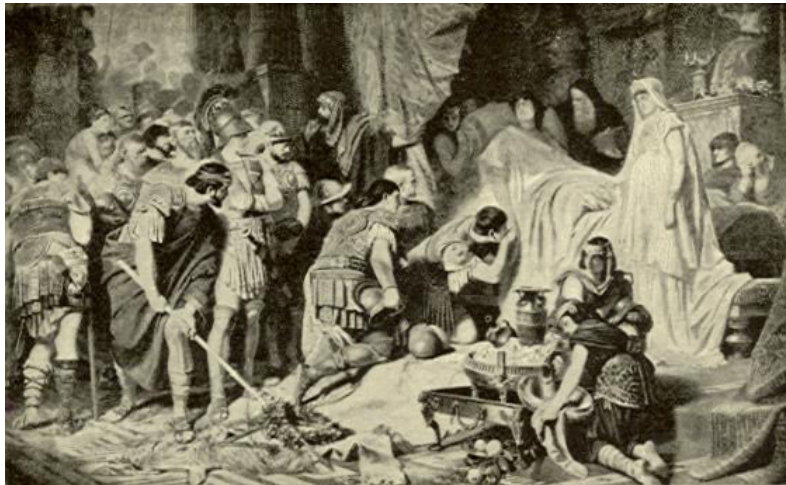
Prilog 7. Prikaz smrti Aleksandra Velikog

Jedna ekspedicija ogromnih razmjera imala je za cilj Kartagu i Heraklove stupove. Aleksandar se također spremao pokoriti Siciliju i Italiju. U jesen 324.pr. Kr. u Egbatani, Aleksandar je doživio težak udarac, najbolji i najintimniji njegov prijatelj Hefestion je preminuo. 62 Naredio je opću žalost u cijelom Carstvu do dana pogreba. Tijelo pokojnika je preneseno u Babilon, ali nije pokopan uz božanske počasti na Aleksandrovu odluku, jer su ga držali za heroja. Hefestionova smrt bila je najteži udarac koji je doživio Aleksandar. Kako bi utišao bol za izgubljenim prijateljem, krenuo je s Ptolomejem u zimu 324./323.pr. Kr. u pohod protiv ratobornog plemena Kosejaca, u oblast Luristana, koja se nalazila između Medije i Suzijane. Četrdeset dana ih je vodio po mrazu, po brdovitom i teškom terenu. To je bilo posljednje Aleksandrovo ratovanje.