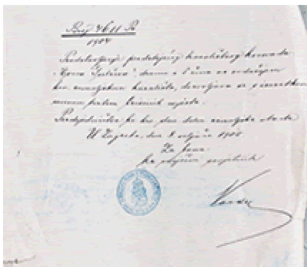
Slika 3. Mišljenje cenzora o rukopisu Evice Gupčeve 56