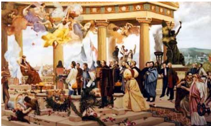
Slika 2. Vlaho Bukovac, Hrvatski narodni preporod

U obradi Ilirizma kao motivacija može poslužiti slika pod rednim brojem 2 Vlahe Bukovca Hrvatski narodni preporod koja je simbol spomenutog razdoblja.