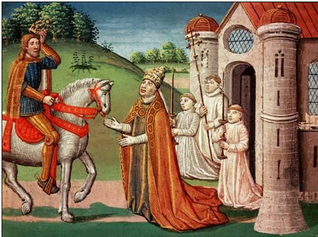
Prilog 3: Karlo Veliki i papa Hadrijan I.

Karlo je bio prvi, i jedan od najplemenitijih, u nizu careva, koji su Rimu jasno dali do znanja kako su papa i car čuvari vjere. Crkva je za njega bila sredstvom vlasti što su je provodili biskupi, a on je osobno presjedao franačkim sinodima. Plan da reformira i franačku i rimsku crkvu primjenom pravila sv. Benedikta, posijao je sjeme kasnije europske ideje da kršćanski kraljevi nisu dužni samo štiti Crkvu, nego i skrbiti o zdravu vjerskom životu u svojim zemljama. 50