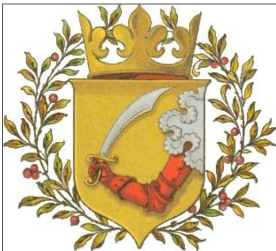
Prilog 2. Grb BiH u vrijeme Austro-Ugarske uprave

Međutim pitanje državno-pravnog uključivanja BiH u postojeću ustavnu strukturu Monarhije ostalo je i dalje otvoreno. Do aneksije BiH je formalno-pravno bila osmanska provincija, mada je stvarna vlast pripadala Austro-Ugarskoj. Iako je nakon aneksije BiH formalno-pravno postala austro-ugarska pokrajina, ona je ipak zadržala specifičan položaj, odnosno nije pripadala ni austrijskom ni ugarskom dijelu Monarhije. Smatrana je krunskom zemljom Habsburgovaca, kojom upravljaju vlade Austrije i Ugarske, kao i od