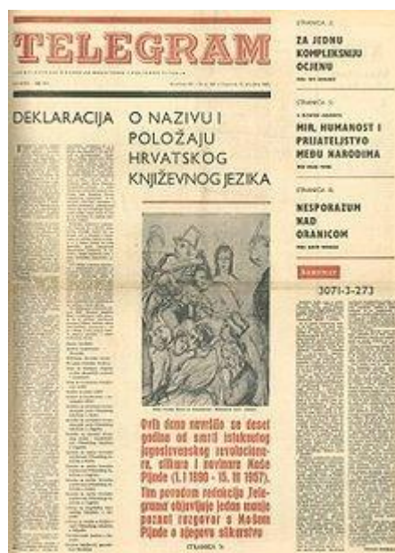
Slika 2. Deklaracija o nazivu i položaju hrvatskog književnog jezika

Sve veći otpor jezičnom unitarizmu slio se u Deklaraciju o nazivu i položaju hrvatskog književnog jezika. Deklaracija je nastala u Matici hrvatskoj. Potpisale su je brojne hrvatske kulturne i znanstvene ustanove. Objavljena je 17. ožujka 1967. Deklaracija se usadila u svijest hrvatskoga naroda kao dokaz da je moguće pružiti otpor unitarističkim ostvarenjima Novosadskog dogovora. Hrvatski su jezikoslovci nastavili rad u tišini i to na projektu nove hrvatske gramatike. Također su počeli prikupljati građu za obradu jednosveščanoga rječnika hrvatskog književnog jezika. 6