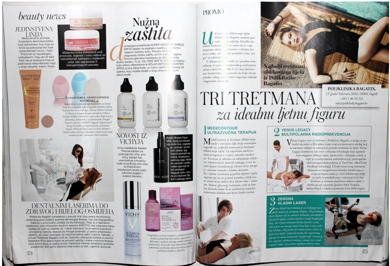
Slika 14: Rubrika beauty news i promotivni članak (SB: 174-175)

Odricanje od odgovornosti promotivnog članka koji se nalazi na desnoj strani (slika 14.) već je spomenuti izraz PROMO , no na lijevoj strani u rubrici beauty news također nalazimo segment o Poliklinici Bagatin koja je subjekt promotivnog članka s desne strane. Tu nemamo takve napomene. Je li takav sadržaj objektivna vijest i na njega ni na kakav način nije utjecao ugovor za pet stranica promotivnog članka?