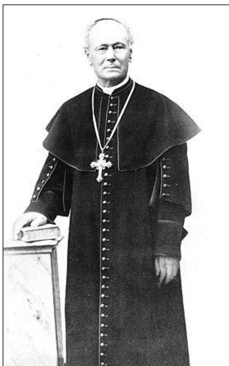
Prilog 1. Biskup Josip Juraj Strossmayer

Strossmayer je po svojoj prirodi bio više čovjek kulture nego politike, više mecena negoli državnik. Zasigurno njegove najveće zasluge što se tiče hrvatskog naroda su one na kulturnom i prosvjetnom planu. Već u ranoj fazi sročio je svoje geslo Prosvjetom k slobodi . 10 Biskup je tako za svoga života financirao i otvorio mnoge kulturne i prosvjetne institucije kao što su škole, gimnazije, čitaonice, a pomagao je i gradnju prometnica. Na sjednici je Banske konferencije 10. prosinca 1860. godine predao banu Šokčeviću zakladni list od 50 000 forinti za osnivanje Akademije. Tim činom pokrenuo je inicijativu za osnivanje Akademije u Zagrebu. 11 Prigodom ustoličenja za velikog župana Virovitičke županije, biskup Strossmayer darovao je 11. veljače 1861. institucije i pojedince: Glagolitičkom sjemeništu u Dalmaciji, Gimnaziji u Sinju, za siromašne učenike Gimnazije u Osijeku, Gimnaziji zagrebačkoj, Mirovinskoj zakladi Virovitičke