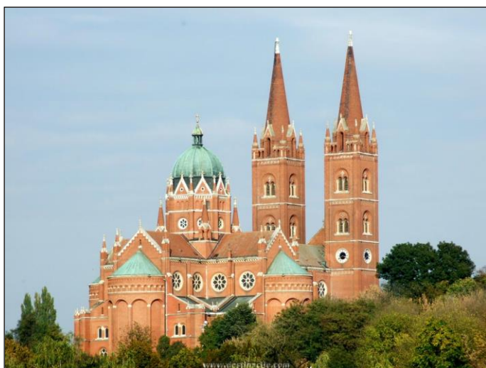
Prilog 2. Đakovačka katedrala

Kad je započeo gradnju Đakovačke katedrale, Strossmayer je poslao dopis Namjesničkom vijeću u Zagrebu da ono potakne Gradsko poglavarstvo u Osijeku i same župljane Gornjega grada na izgradnju nove župne crkve. Za taj projekt, crkvu kakvu je on zamišljao, trebala je golemo svota novca. Sam je priložio 10 000 forinti kao polog, ali ipak je za početak gradnje trebalo proći gotovo tri desetljeća. Konačno, 4. kolovoza 1894. g., započela je izgradnja nove crkve u neogotičkom stilu s tri prostrane lađe i vrlo visokim tornjem, kakva nigdje u Hrvatskoj nije postojala. Dvije godine prije početka gradnje i prihvaćanja plana crkve, napisao je Strossmayer Odboru za izgradnju: Ja sam odlučno za gotički stil, a ako taj nije moguć, onda romanski, a nipošto renaissance. Osijek je za tolike žrtve valjda zavriedio da imade u svojoj sredini podpuni umjetnički spomenik zašto renaissance nije, jer renaissance nije za crkve. To golemo zadnje crkve bilo je gotovo do kolovoza 1899. godine, dok su unutrašnji radovi još bili u tijeku. Biskup Strossmayer odlučio je da će posvetu crkve osobno obaviti 20.