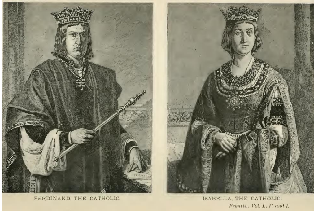
Prilog 3. Ferdinand Aragonski i Izabela Kastiljska