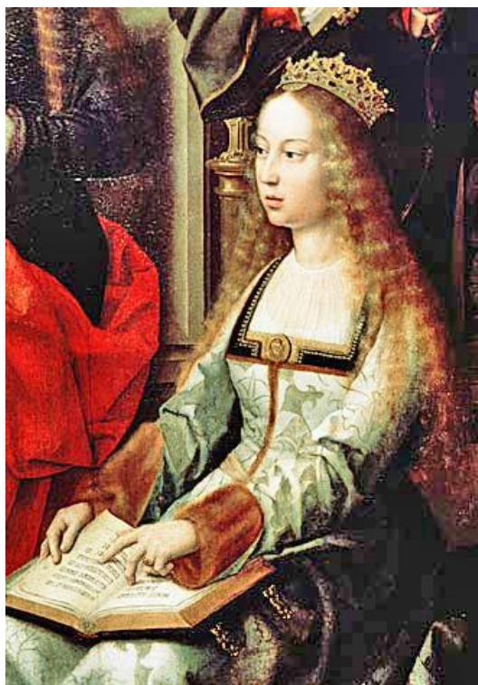
Prilog 1. Kraljica Izabela I. Kastiljska