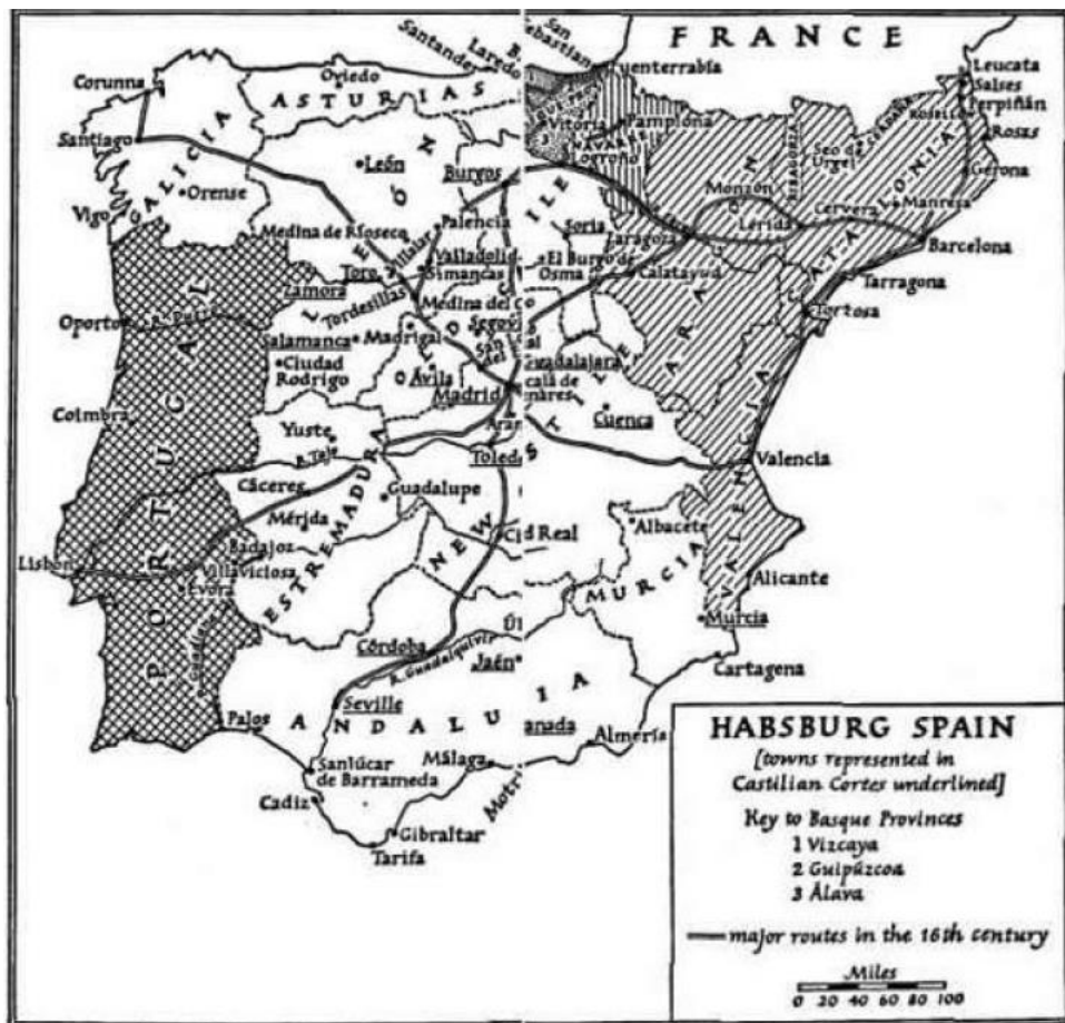
Prilog 7. Habsburška Španjolska