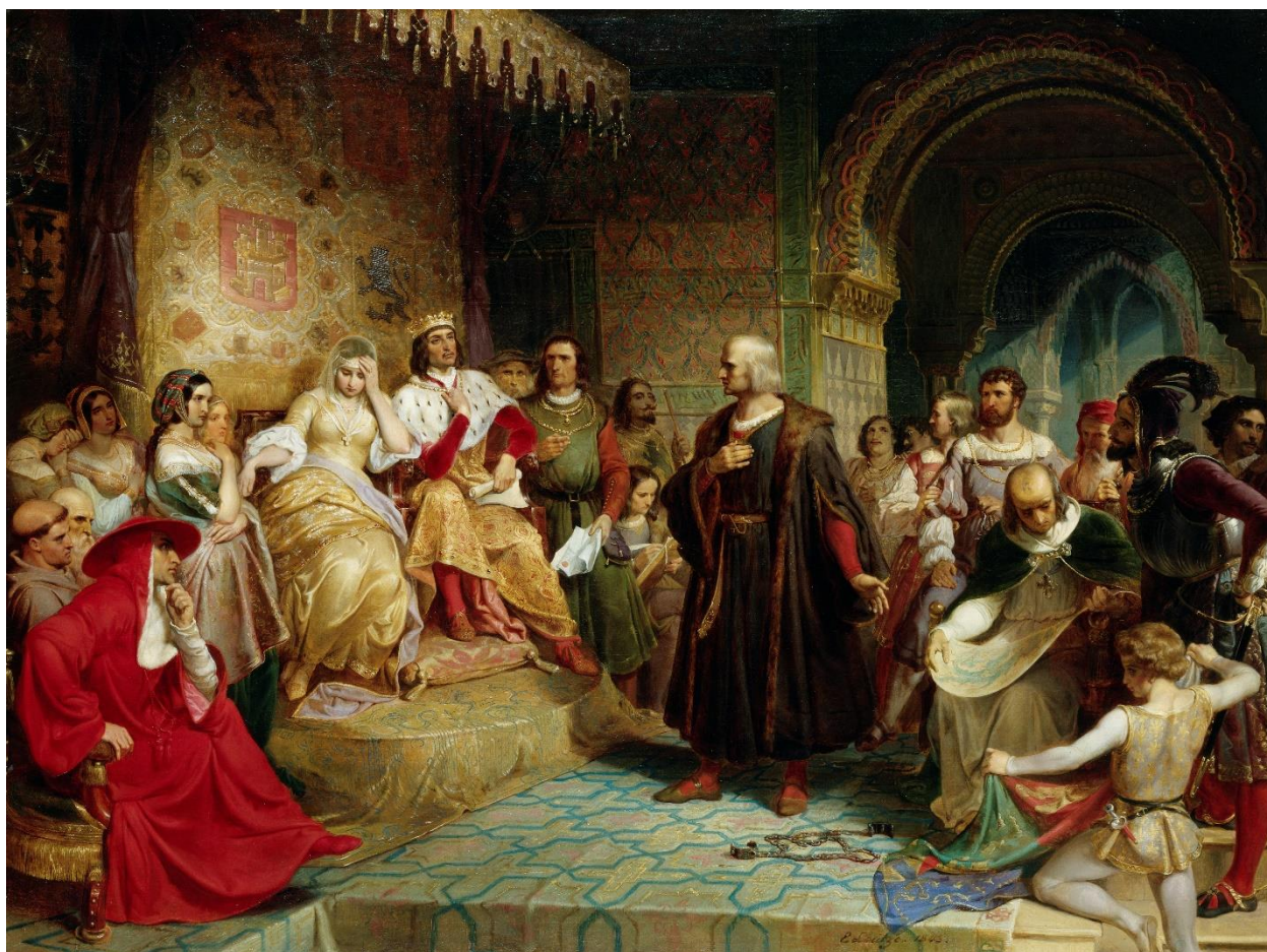
Prilog 6. Izabela i Ferdinand primaju Kolumba