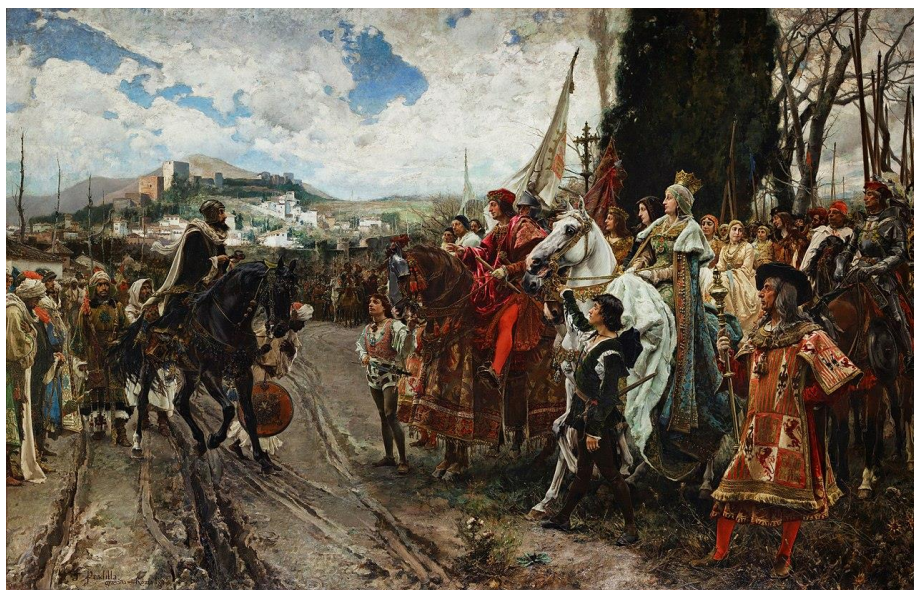
Prilog 5. Predaja Granade ( La rendición de Granada , Francisco Pradilla 1882.)