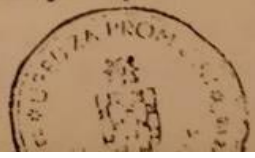
Slika 4. Popis zabranjenih knjiga iz 1942. godine 52

Deseterica s lomačo. 1000 najljepših novela /svi sv u kojima se nalaze prilosi pri navodnih pisaca/ Nova ruska proza Hitler osvajač "Nolit" i sva latinica na srpsk jeziku.-Novi ruski humor Židovski humor.