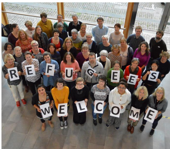
Slika 2. Refugees welcome 53

Jedna od europskih država s najvjerojatnije najduljom tradicijom narodnih knjižnica i raznovrsnih knjižničnih usluga jest Velika Britanija. Britanska knjižnična zajednica osmislila je program pod nazivom Dobrodošli u svoju knjižnicu ( www.welcometoyourlibrary.org.uk ) s namjerom da se narodne knjižnice povežu s izbjeglicama i azilantima. 54 Taj je program 2003. godine pokrenut kao pilot-projekt u suradnji pet londonskih gradskih općina, a do kraja 2007. godine proširen je na čitavu zemlju. 55 Projekt je financirala Zaklada Paula Hamlyna, a koordinira ga Agencija za razvoj londonskih knjižnica. 56