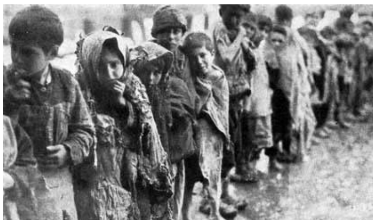
Prilog 10. Armenska djeca u marševima smrti.