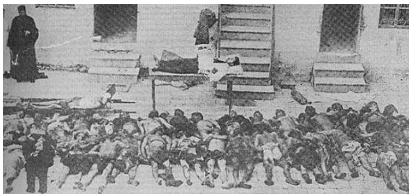
Prilog 4. Armenci masakrirani u Aleppu nakon 1918. godine