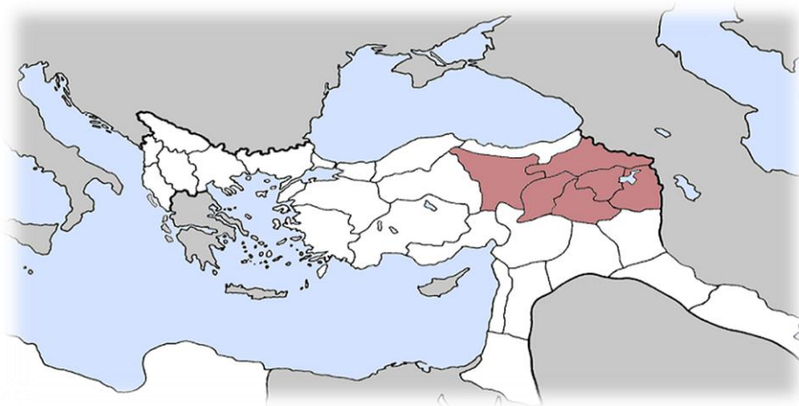
Prilog 2. Prikaz teritorija naseljenog Armencima unutar Osmanskog Carstva početkom 20. stoljeća.