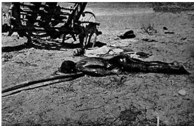
Prilog 7. Silovana, potom ubijena žena kraj trupla svog djeteta.