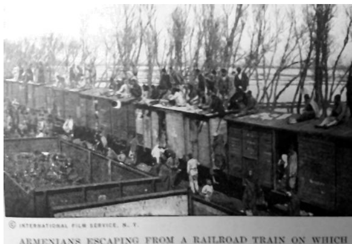
Prilog 5. Transport Armenaca u logore.