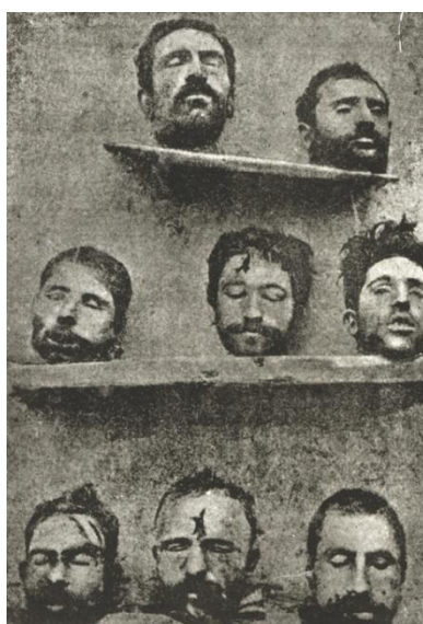
Prilog 6. Glave odrubljene ubijenim Armencima koje su služile kao trofeji.