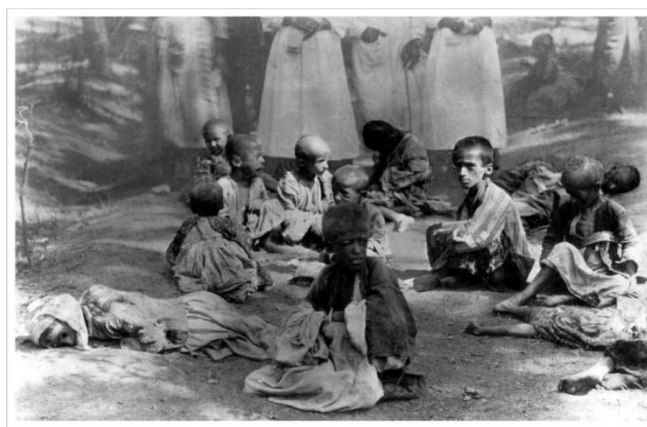
Prilog 11. Izgladnjela armenska djeca na ulicama.