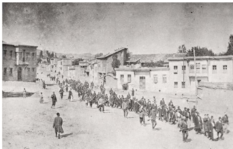
Prilog 3. Marševi nenaoružanih Armencina prema zatvoru u Mezirehu.