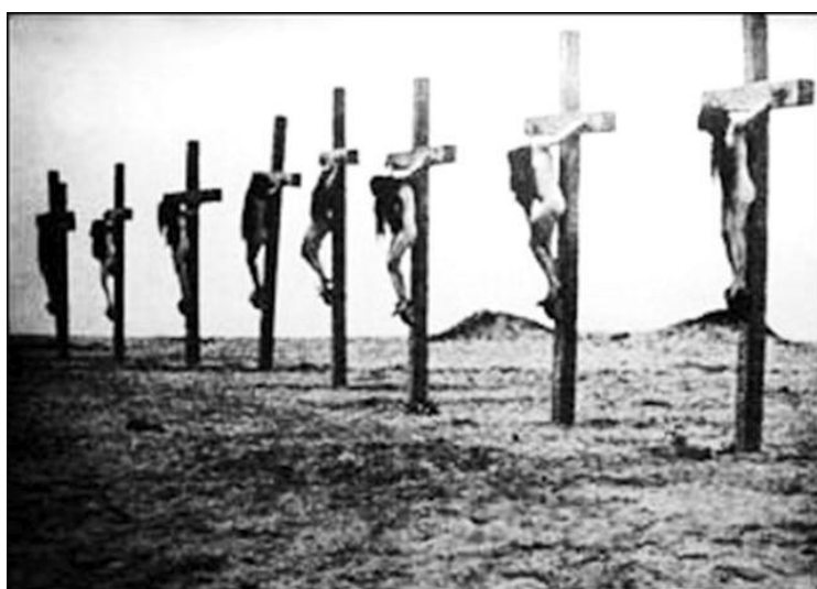
Prilog 8. Silovane armenske žene, potom pribijene na križ.