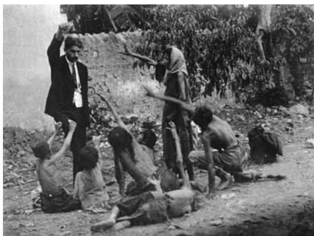
Prilog 9. Turčin izgladnjelu armensku djecu komadom kruha.