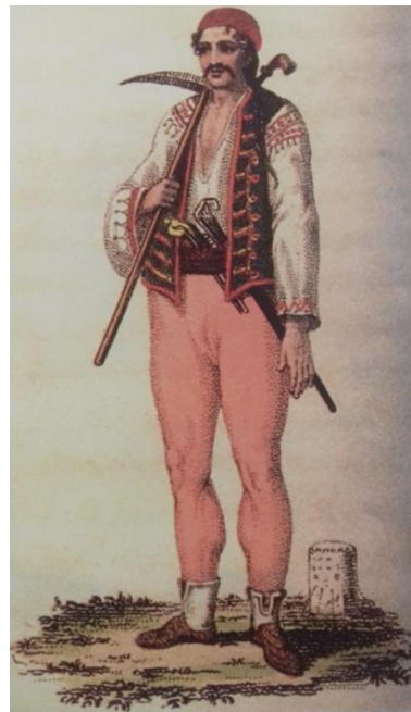
Uskočki vođa (vojvoda), bakrorez, 17. st. Uskok, jedna od najstarijih ilustracija