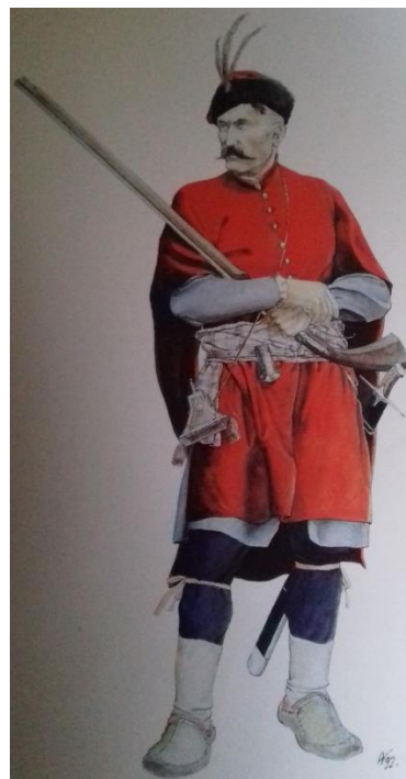
Uskok iz Senja