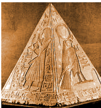
Prilog 7: Prikaz Benbena

Benben je bio obelisk u obliku male piramide koji je predstavljao boga Sunca Ra. Govorilo se da je sveti obelisk Benben prva stvar koju svako jutro dotaknu zrake Sunca u hramu u Heliopolu. Prema jednoj od kozmogeneza, smatra se da je Benben simbolizirao prvi komad zemlje u obliku brežuljka koji je nastao iz vodenog kaosa. 19 Obelisk Benben se u egipatskoj mitologiji često povezuje sa svetom pticom boga Ra Bennu, koja je sletjela na njegov piramidalni vrh. Kada su za vrijeme Pete dinastije hramovi posvećeni bogu Sunca postali popularni, središte štovanja u dvorištima hramova bio je obelisk koji se nalazio na podignutoj platformi. Benben obelisci koji su napravljeni za vrijeme Pete dinastije služili su kao prototip za kasnije visoke obeliske koji su se nalazili na ulazima hramova za vrijeme Novog kraljevstva.