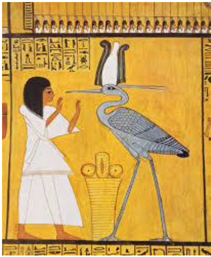
Prilog 8: Prikaz ptice Bennu