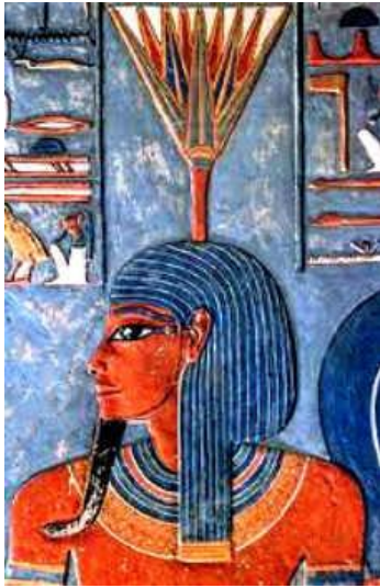
Prilog 6: Prikaz boga Nefertuma

Nefertuma su zvali i „čuvarom pred Raovim nosnicama” jer su samoga boga Sunca Raa često slikali kako pred nosom drži lotosov cvijet.