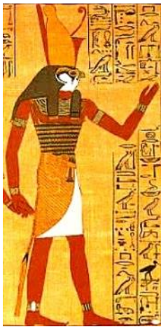
Prilog 3: Prikaz boga Horusa

Harmakhis je simbolizirao Sunce koje izlazi i često je bio povezan s bogom Khepriem. Njegovo ime značilo je „Horus na obzorju”. Prikazivan je kao čovjek s glavom sokola koji nosi mnoštvo kruna ili kao lav s glavom sokola ili ovna. Najpoznatiji prikaz Harmakhisa je sfinga kod Gize koja je predstavljala velikog lava s ljudskom glavom koji nosi faraonsku krunu. Smatra se da je Harmakhis ne samo bog Sunca nego i bog najvećeg znanja.