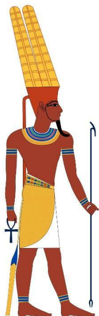
Prilog 2: Prikaz boga Amona

Za vrijeme Nove države Amon-Ra dobio je ime „kralj bogova”. Smatralo se da je Amon-Ra, poput ranijih oblika boga Sunca, faraonov otac. Amon-Ra je uz to imao i kozmičke funkcije jer je bio stvoritelj te je kontrolirao vrijeme i godišnja doba. On se vozio u svojem Sunčevom čamcu po nebu, zapovijedao vjetrovima i oblacima i održavao sva stvorenja i vegetaciju. Amon-Ra bio je poznat kao bog kojega su iznimno štivali i obični ljudi te je zato dobio nazive kao što je „vezir siromašnih” koji je bio pravedan i nepodmitljiv. Prikazivan je i kao suosjećajan bog i otac koji voli svoj narod. Štovanje kulta Amona-Raa počelo je opadati nakon što su Asirci zauzeli Tebu i njegovo mjesto zauzelo je štovanje Ozirisova kulta.