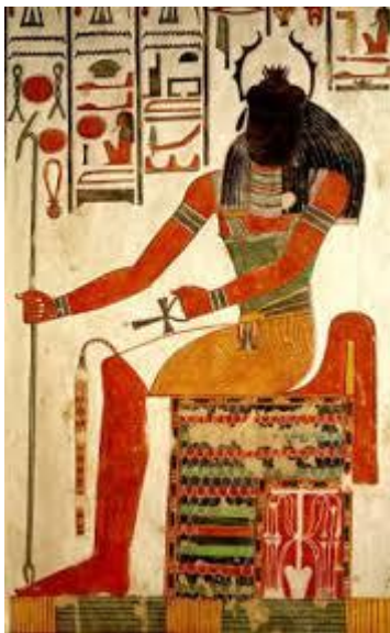
Prilog 5: Prikaz boga Kheprija

Zbog njegove moći samoobnavljanja Kheprija se ponekad izjednačava sa stvoriteljem Atumom, ali se ponekad povezuje i s Ozirisovim zagrobnim životom. Prikaz Kheprija kao skarabeja pojavljuje se u piramidama Staroga kraljevstva, a od vremena Srednjega kraljevstva se pojavljuje u obliku amuleta i na pečatima. Smatralo se da su ti prikazi skarabeja povezivali vlasnika s bogom Sunca i vjerovalo se da donose sreću. Većina hramova posjedovala je prikaz boga Kheprija isklesanog u kamenu što odražava vjerovanje Egipćana da je hram bio mjesto iz kojeg bog Sunca izranja kako bi nastavio stvaranje kozmosa.