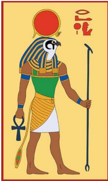
Prilog 1: Prikaz boga Ra

Raa su štovali u svim hramovima ostalih bogova jer je vrhovni svećenik bio božanski faraon po uzoru na Raov kult u Heliopolu. Faraone su tako usko vezali s kultom boga Ra da su njihove naredbe imale božanski autoritet. Smatralo se da su duše umrlih faraona služile u obliku zvijezda kao posada Sunčevih čamaca. 7 Kult boga Ra sačuvalo je svoju moć čak i kad je Ozirisov kult bio na vrhuncu zbog uloge branitelja političkog poretka.