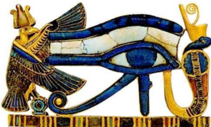
Prilog 9: Prikaz uđata

Uđat je isprva bilo oko boga Atuma. Prema jednom od mitova, Atum je poslao svoje oko da potraži Šu i Tefnut, a nagrađeno je time što je smješteno na Atumovo čelo. Uđat je postao dio mitologije o bogu Ra nakon što je Ra izjednačen s Atumom. Nakon što je oko svojevrijem otputovalo, Ra je poslao boga Totha da ga dovede natrag. Kada se oko vratilo Rau, razbjesnulo se jer ga je Ra zamijenio drugim okom. Ra je smirio oko tako što ga je u obliku zmije ureus smjestio na svoje čelo. Oko je tako postalo vladar svijeta te su ga nosili faraoni kao simbol svojega veličanstva. Smatralo se da uđat ima moć iscjeljivanja te je stoga bio jedan od najpopularnijih amuleta u Egiptu. Kasnije se uđat kao simbol počinje povezivati i s bogom Horusom.