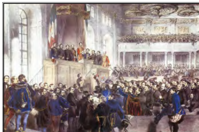
Mađarski sabor 5. srpnja 1848.

U međuvremenu je bečki dvor počeo polako istraživati mogućnosti suprotstavljanja Mađarima. Tako je ubrzo shvatio da jedino što može učinkovito iskoristiti protiv mađarske vlade jest njihova politika prema nemađarskim narodima. Razmotrivši od kojeg naroda može potražiti "pomoć", shvatio je da je Hrvatska, ne samo svojim težnjama za nacionalnom slobodom nego i zemljopisno, najbolji saveznik. Iskoristivši činjenicu da je delegacija hrvatskog naroda upravo bila u bečkom dvoru zbog priznavanja "Zahtijevanja naroda", također su zatražili neovisnu vladu i da kralj odobri bansku čast Josipu Jelačiću. No bečki dvor, odnosno car samo je priznao bansku čast Jelačiću. Vrativši se u Hrvatsku i stupajući na bansku čast Jelačić je prekinuo svaku vezu s Ugarskom. Naredio je da hrvatski uredi ne smiju provoditi nijednu odluku koja dolazi od mađarske vlade. Istovremeno su se pogoršavali odnosi između Mađara i Srba, koji su u svibnju 1848. godine proglasili samostalnu Srpsku Vojvodinu. (Brankovics, 1909: 54-59)