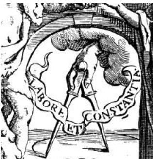
Prilog 7. Plantine t. znak