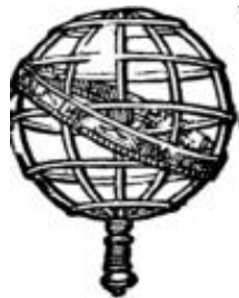
Prilog 8. Elzevir kugla